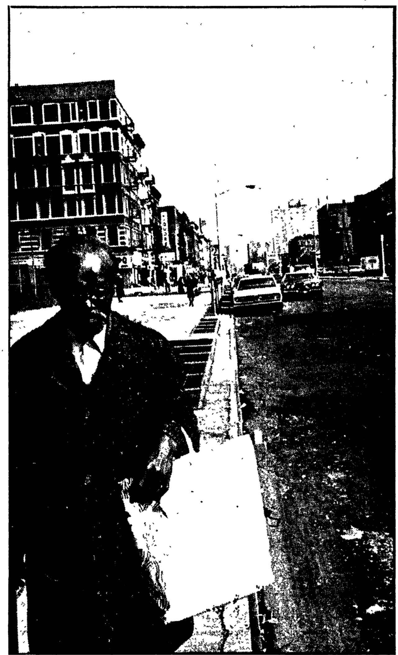
Un vecchio portoricano a New York, nel suo quartiere povero. Dal 1917 i portoricani, grazie ad una apposita legge, hanno avuto l'onore di mutare la loro cittadinanza in quella statunitense.