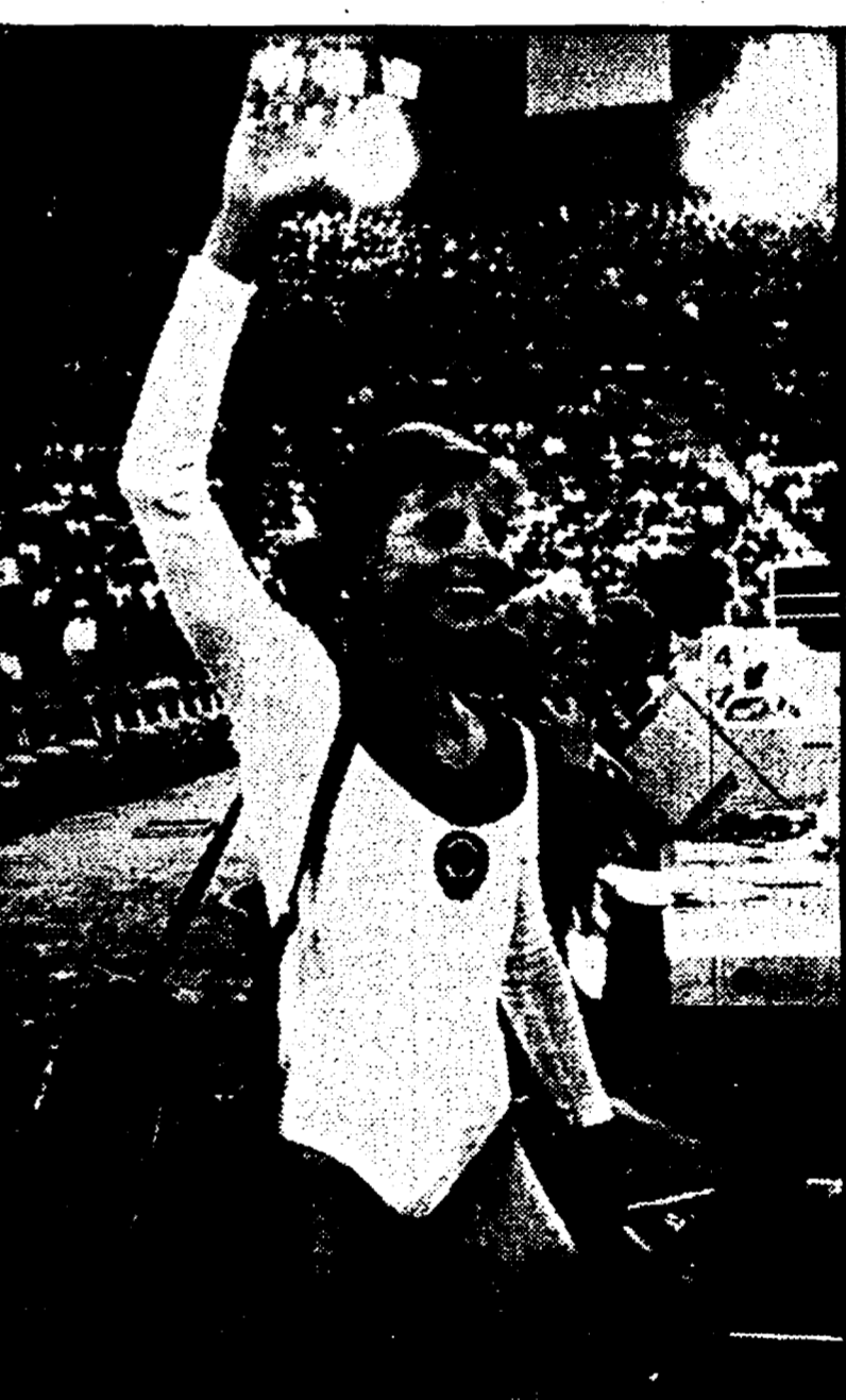
La giovanissima OLGA KORBUT dopo il trionfo di Monaco