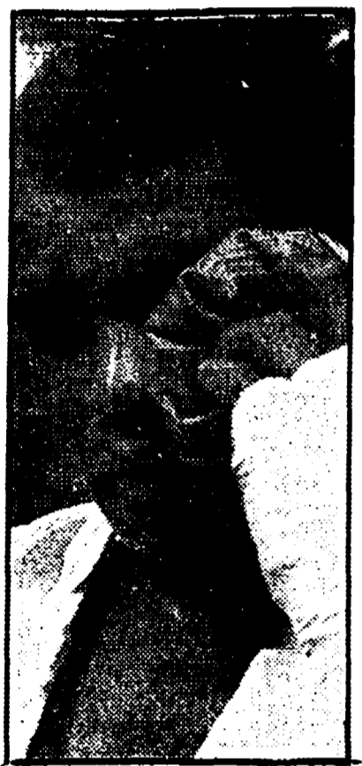
Clay ha pagato la vittoria a caro prezzo: con un occhio chiuso dai colpi, con vaste ferite al volto che hanno richiesto 5 punti di sutura