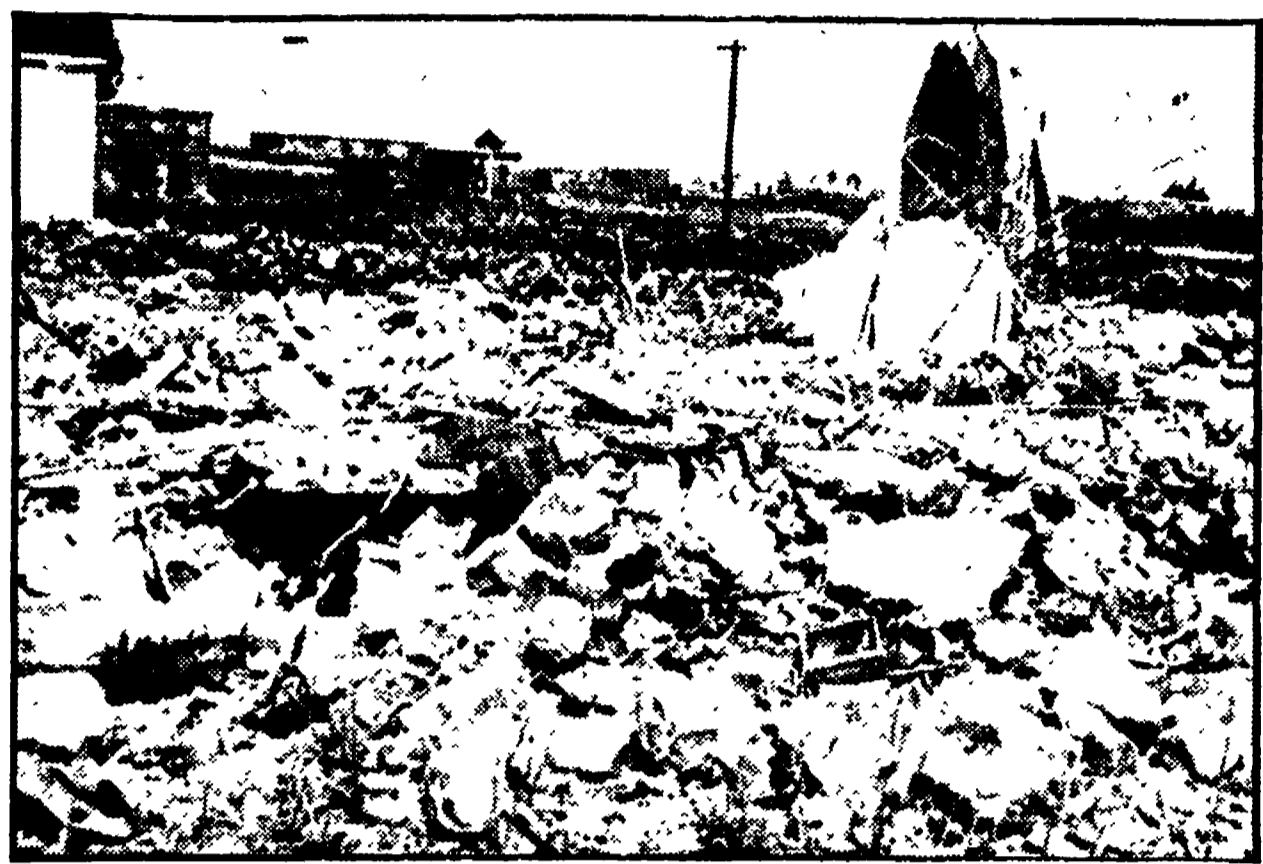
SIRIA — Macerie di case di abitazione civile dopo un bombardamento aereo israeliano