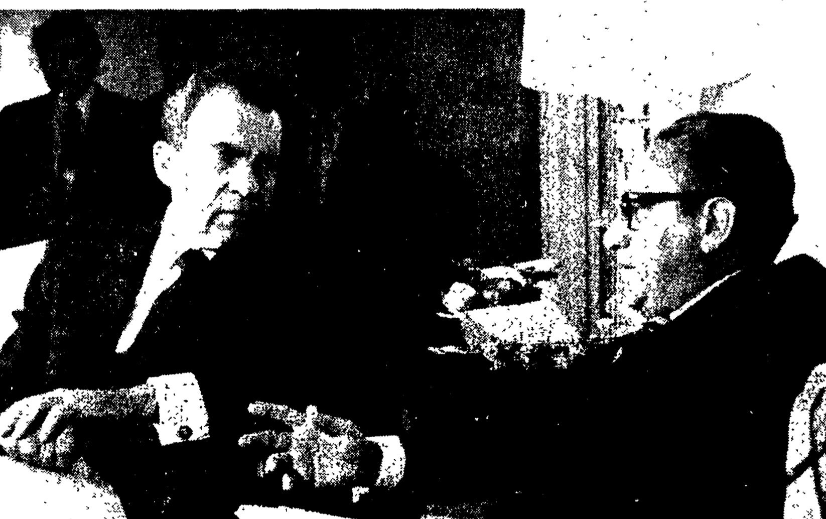
NEW YORK - Nixon e Kissinger durante l'incontro al Waldorf Astoria. Dopo tale conversazione il portavoce della Casa Bianca Ronald Ziegler ha dichiarato che il Presidente è sicuro che si giungerà nel Vietnam a una giusta forma di accordo...

Sul terzo punto gli americani tornano alla vecchia tesi della simultaneità del ritiro delle truppe dal Sud Vietnam mettendo sullo stesso piano aggressori ed aggrediti.