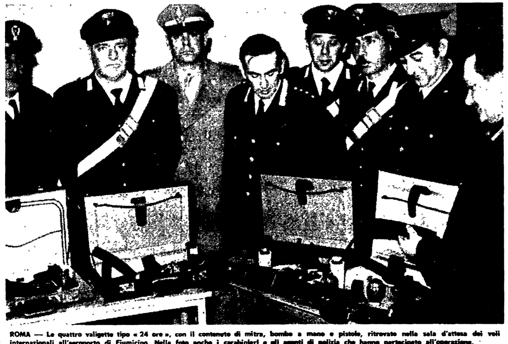
ROMA - Le quattro valigette tipo «24 ore», con il contenuto di mitra, bombe a mano e pistole, ritrovate nella sala d'attesa dei voli internazionali all'aeroporto di Fiumicino. Nella foto anche i carabinieri e gli agenti di polizia che hanno partecipato all'operazione.

I bagagli lasciati nella sala transiti internazionali contenevano mitra inglesi, otto bombe a mano, quattro bombe incendiarie e due pistole - A Ladispoli una tomba etrusca adibita a deposito di esplosivo