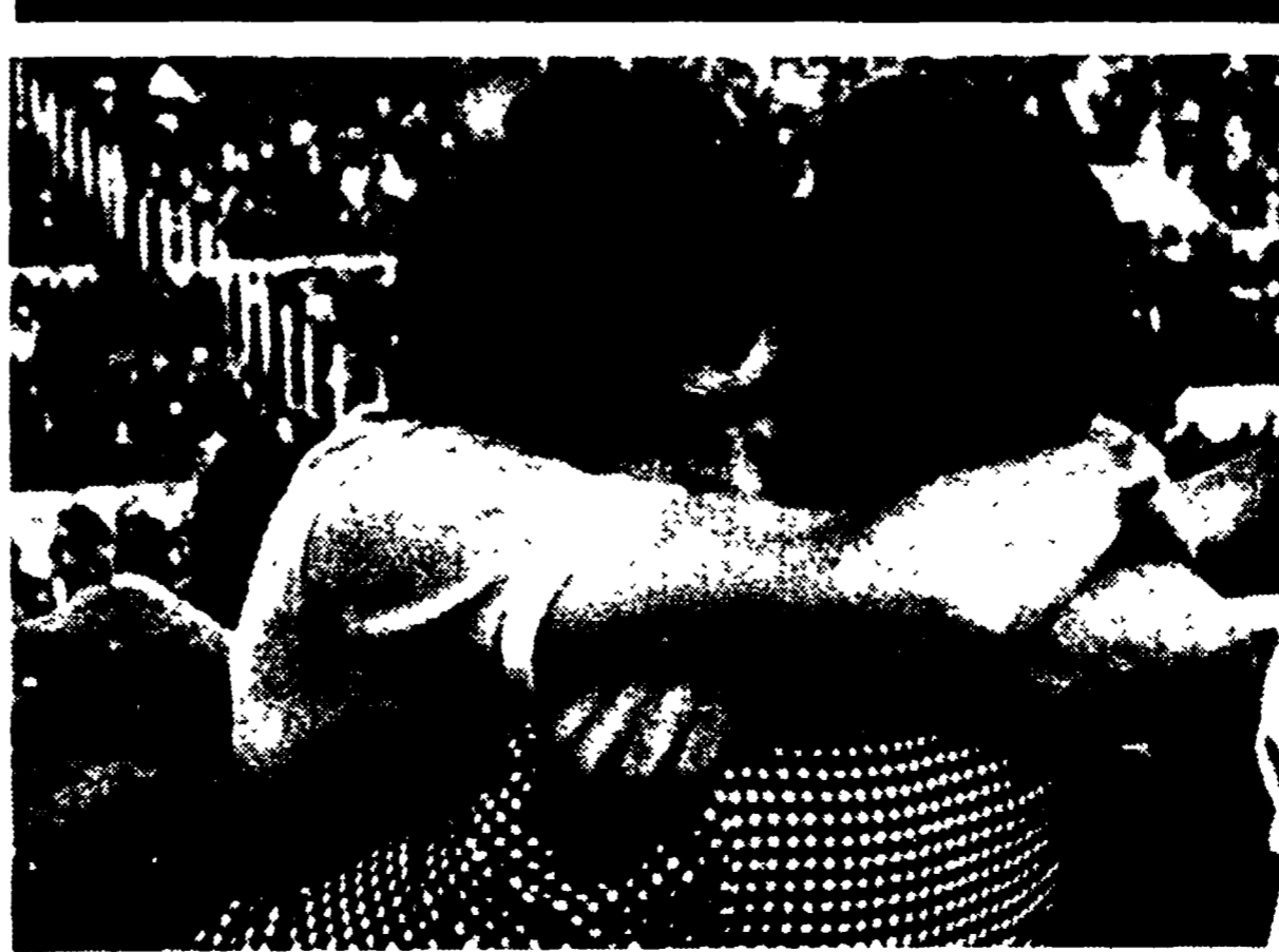
Con una rete di Chinaglia all'ultimo minuto, la Lazio è riuscita a superare il Cagliari, consolidando la sua posizione di leader della classifica di serie A. Hanno preso terreno l'Inter (0-0 a Bergamo), la Fiorentina e il Torino, che hanno dovuto cedere rispettivamente a Juventus e Bologna. Alle spalle dei laziali, resta il Milan, nettamente vittorioso (3-1) sulla Samp. Di rilievo