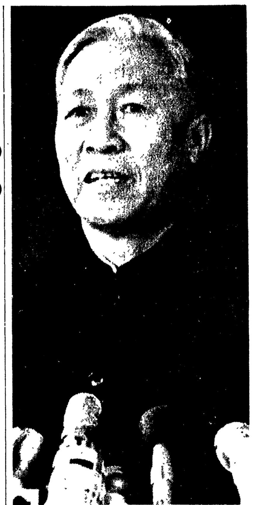
Il consigliere speciale Le Duc Tho, l'interlocutore di Kissinger nei colloqui che riprenderanno a Parigi nella giornata di oggi.

Il consigliere speciale di Nixon, Henry Kissinger, ha fatto ritorno questa notte a Parigi dove, domani, riprenderà il negoziato con i rappresentanti della Repubblica democratica vietnamita. Sarà finalmente l'ultimo «round» che gli americani annunciano da ormai un mese e che regolarmente rinviano, accampando ogni volta nuovi pretesti e nuove esigenze? Indirettamente fatto circolare a Washington e a Saigon dicono che l'armistizio potrebbe essere proclamato fra il 12 e il 15 dicembre: il che lascia intendere che l'accordo interverrebbe a Parigi nei prossimi giorni di ripresa del negoziato se è vero che, secondo le clausole approvate dalle due parti, la cessazione del fuoco deve instaurarsi su tutto il territorio sud vietnamita 24 ore dopo la firma del dispositivo d'accordo.