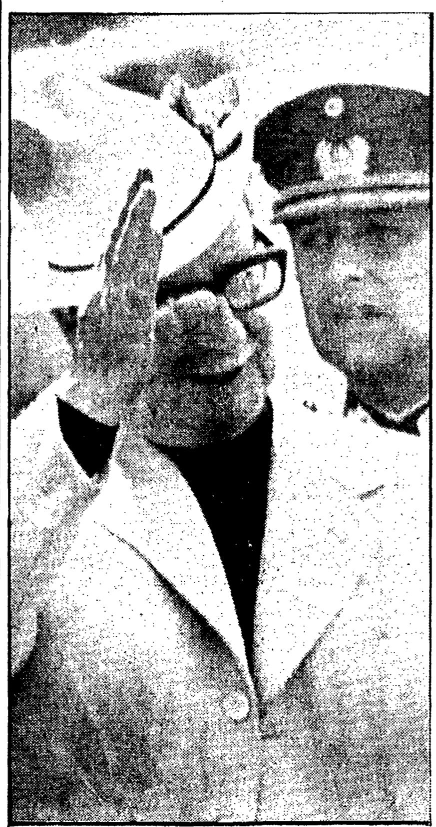
GUADALAJARA DEL MESSICO — Il presidente cileno Allende, nei giorni scorsi in visita in Messico, saluta la folla di Guadalajara che lo acclama

L'ITT e la Kennecott hanno saccheggiato spudoratamente il paese sud-americano per 42 anni e poi hanno organizzato attentati terroristici, assassini politici, colpi di stato ed altre forme di attacco contro il governo popolare legittimamente eletto