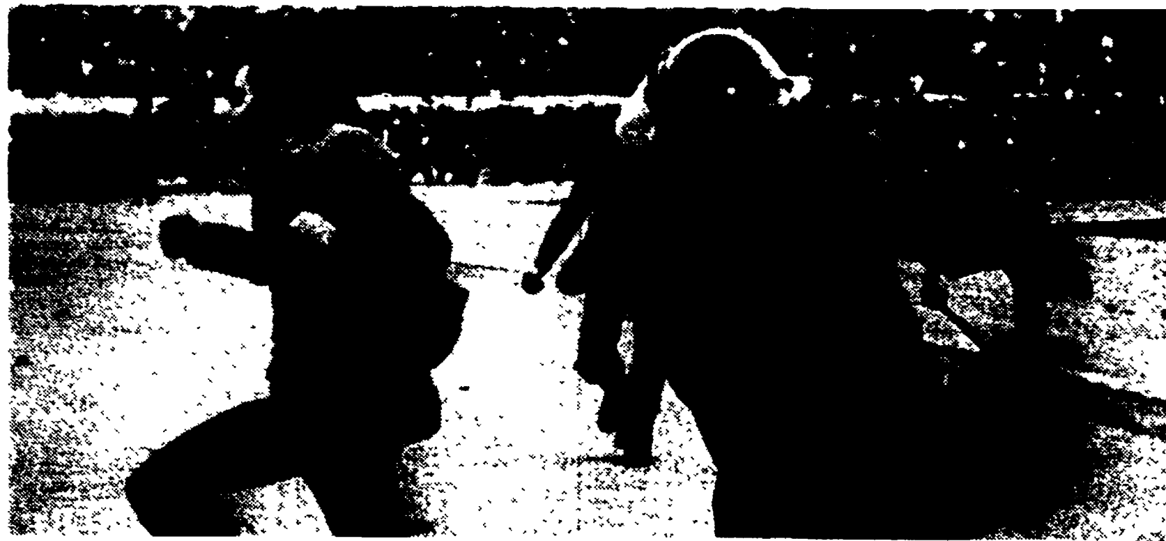
La doppia sfida calcistica Roma-Milano è finita in modo inatteso. All'Olimpico si è registrata un'invasione di campo per un rigore concesso all'Inter all'ultimo momento di gioco, rigore che condannava la Roma alla sconfitta per 2-1.