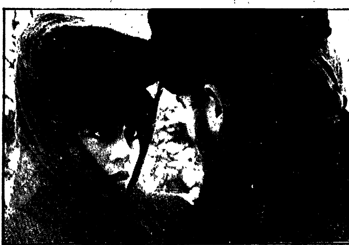
ROROS - Ecco Jane Fonda con James Fox in una scena di «Casa di bambola», il film tratto dall'omonimo dramma di Ibsen...