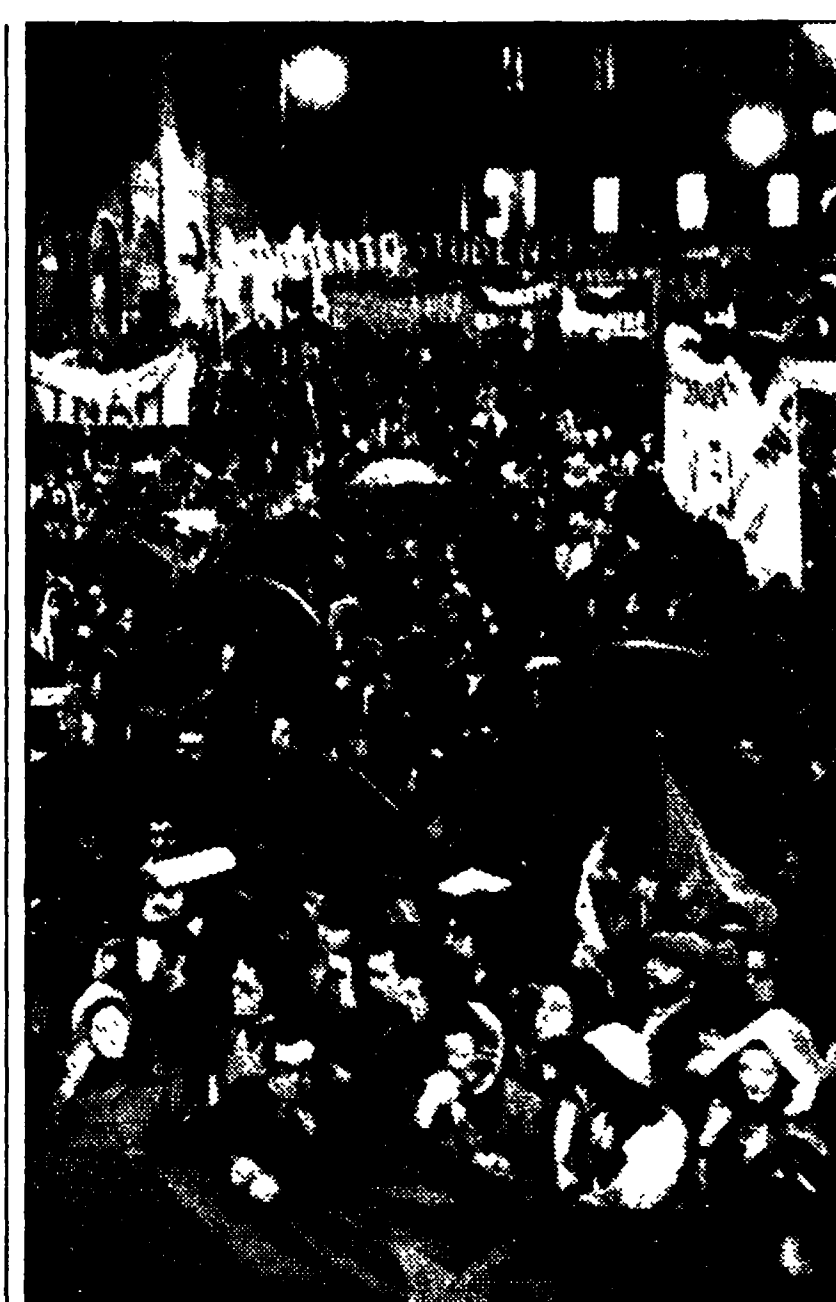
Uno scorcio della manifestazione di 40 mila giovani e lavoratori romani di venerdì sera contro i bombardamenti USA nel Vietnam