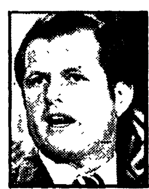
KENNEDY - Appello al Congresso