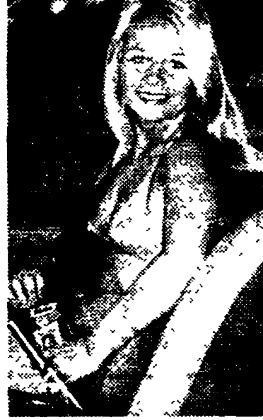
Una bella ragazza di Sydney è stata ingaggiata dall'ufficio australiano per la sicurezza stradale allo scopo di pubblicizzare l'utilità delle cinture di sicurezza.

L'indagine è stata svolta per iniziativa di una delle maggiori compagnie assicuratrici svedesi, la Folksam, che ha pubblicato un rapporto completo sulla questione corredato di diagrammi, carte e dati statistici.