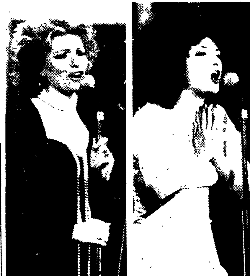
Iva Zanicchi: la prima delle concorrenti femminili.