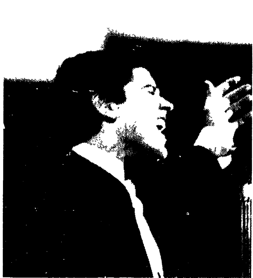
Gianni Morandi, qui nel pieno della sua esecuzione, ha conquistato un onorevole secondo posto.