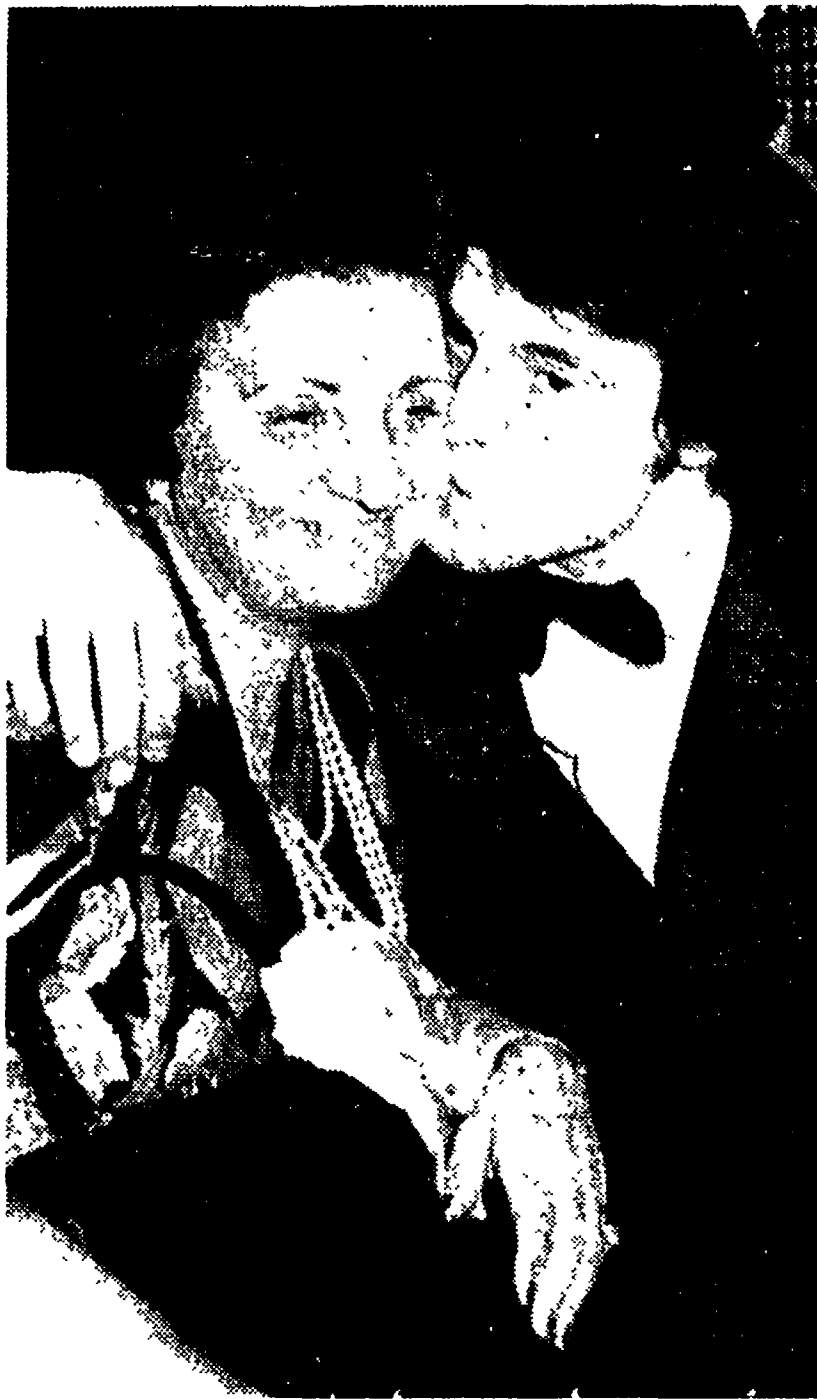
Massimo Ranieri, dopo la vittoria, in affettuoso atteggiamento con la madre.