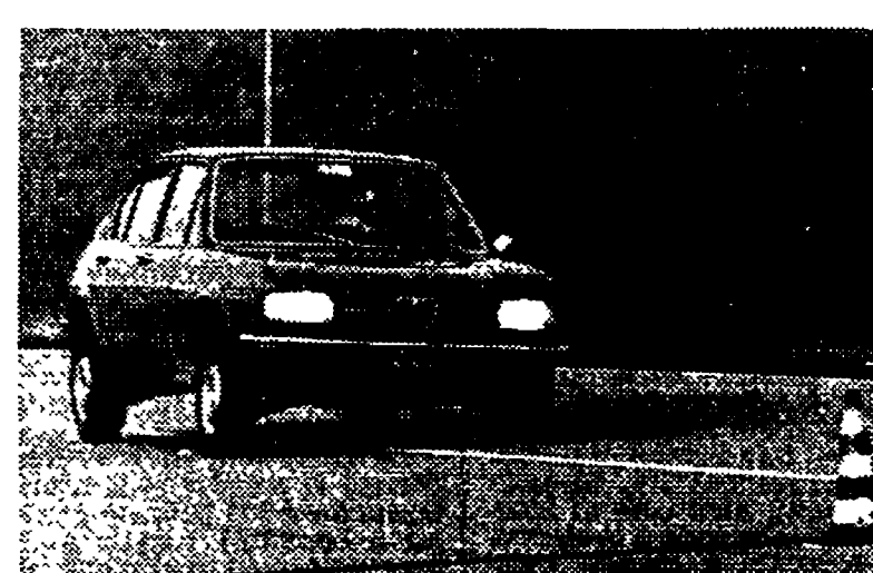
Un'«Alfasud» fotografata durante le prove della vettura alla vigilia del lancio sui mercati internazionali.

Una rassegna dei giudizi espressi sulla vettura di Pomigliano