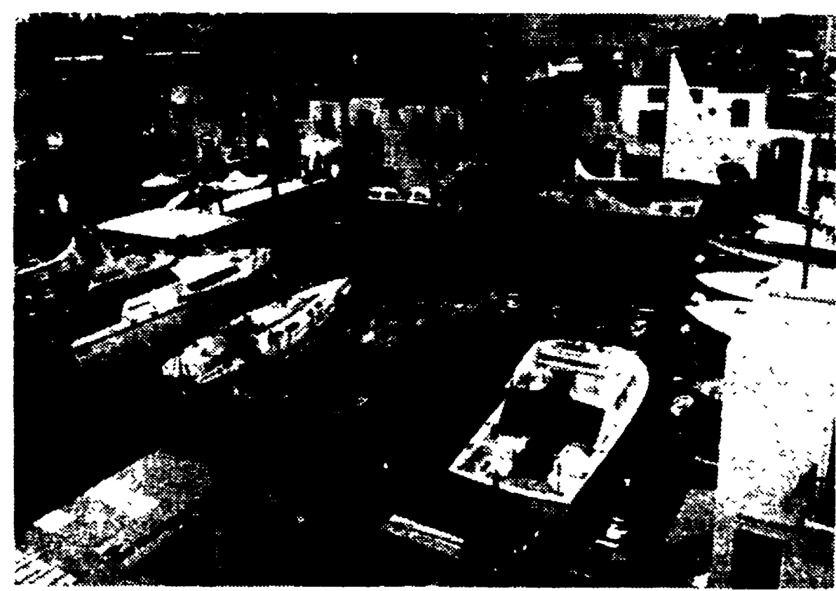
Nel settore della nautica da diporto le barche in plastica fanno ormai da padroni. Lo si è visto anche al Salone internazionale di Londra dove, appunto, 120 per cento delle imbarcazioni presentate erano in plastica. Per mancanza di spazio sono state presentate soltanto seicento imbarcazioni i cui prezzi variano da un minimo di 30 mila lire per una canoa ad un massimo di 100 milioni per un lussuoso panfilo. Nella foto: una veduta dell'esposizione.

In Austria, KRONENZEITUNG e SALZBURGER ANZEIGER affermano rispettivamente: «L'Alfasud è una piccola vettura di alta classe... su strada si rivela maneggevole ed agile...».