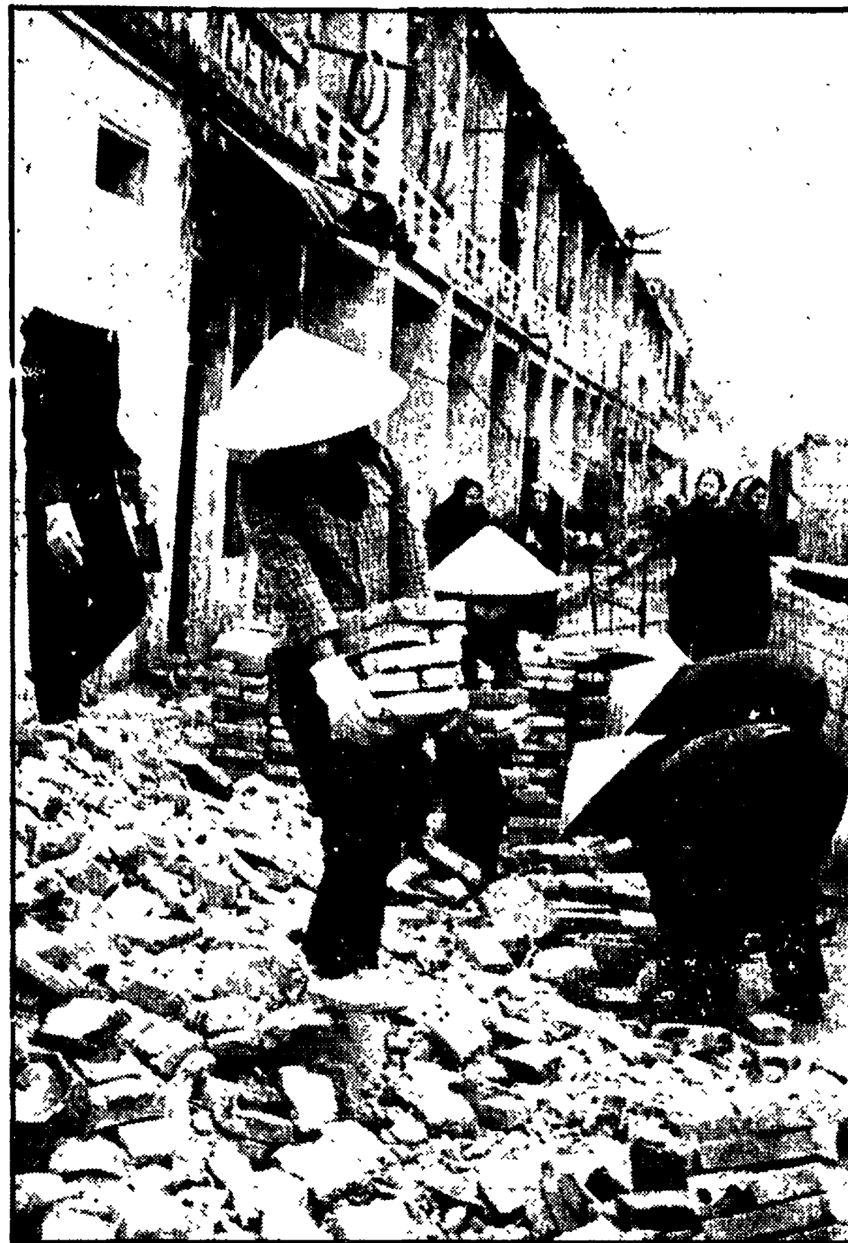
HAIPHONG — Il lavoro di ricostruzione nella via Quan Tung, bombardata il 27 dicembre 1972