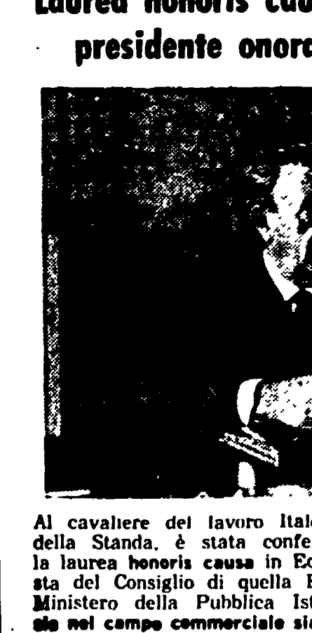
Al cavaliere del lavoro Italo Monzino, presidente onorario della Standa, è stata conferita dall'Università di Perugia la laurea honoris causa in Economia e Commercio, su proposta del Consiglio di quella Facoltà e con approvazione del Ministero della Pubblica Istruzione, «per meriti acquisiti nel campo commerciale e culturale e sociale».

E' in corso la rassegna del pittore Carmine Muliere nei locali della Sala Stampa italiana, in piazza S. Sisto n. 13. La mostra, inaugurata il 15 gennaio scorso, si è conclusa ieri con notevole successo di critica e di pubblico.