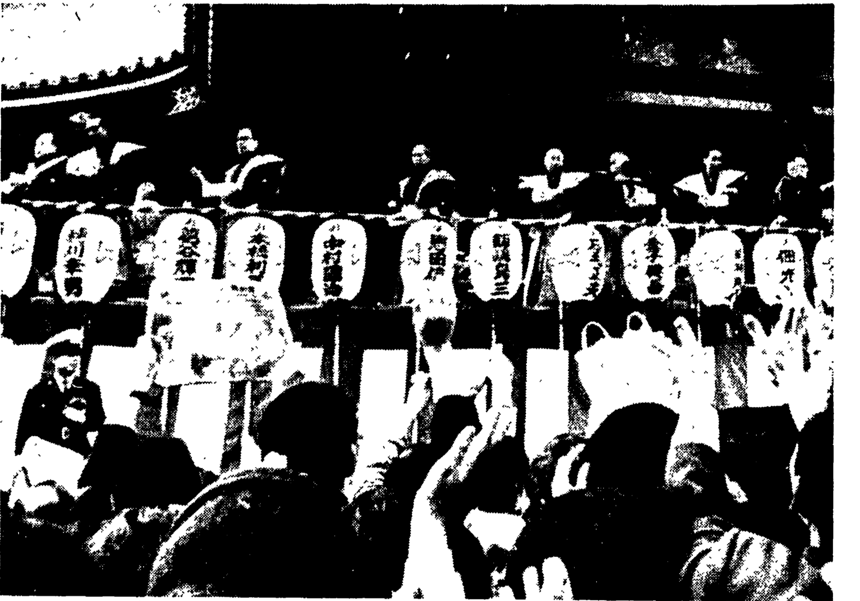
CACCIANO IL DIAVOLO! TOKIO — Giapponesi in costume tradizionale spargono fagioli arrostiti su un gruppo di fedeli e mormorano un salmo che tradotto suona pressappoco così: «Che la fortuna ci aiuti, cacciamo i diavoli!». Questa caratteristica cerimonia coincide con l'inizio della primavera, che per il vecchio calendario lunare giapponese è iniziata sabato. Come si può vedere nella telefonata AP, i fedeli raccolgono l'invito e, con borse di plastica, cercano di recuperare il maggior numero possibile di fagioli, che la tradizione vuole portino fortuna per il nuovo anno.