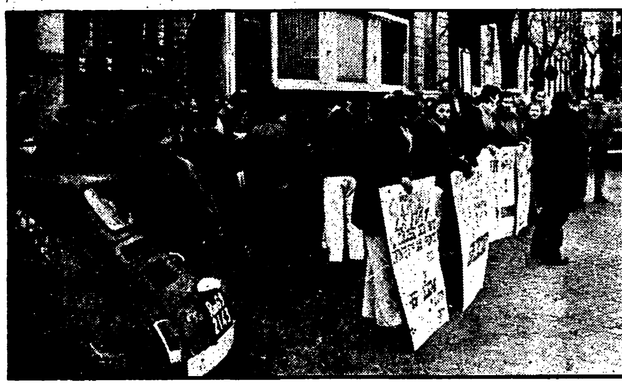
Lavoratori della FIAT durante il picchettaggio alla filiale di viale Manzoni

In consiglio provinciale, comunisti, socialisti, socialdemocratici e repubblicani dichiarano il loro sostegno - Generiche affermazioni di La Morgia - Domani assemblea con i sindacati all'Università - Gli statali assicurano la loro partecipazione