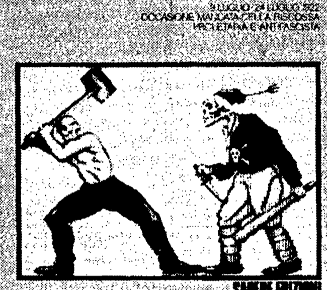
Prezzo L. 2900