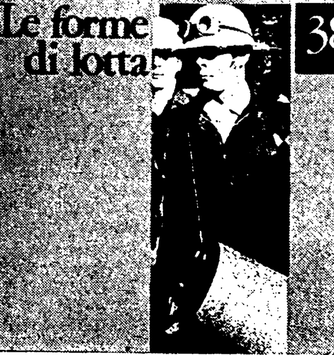
Prezzo L. 1500