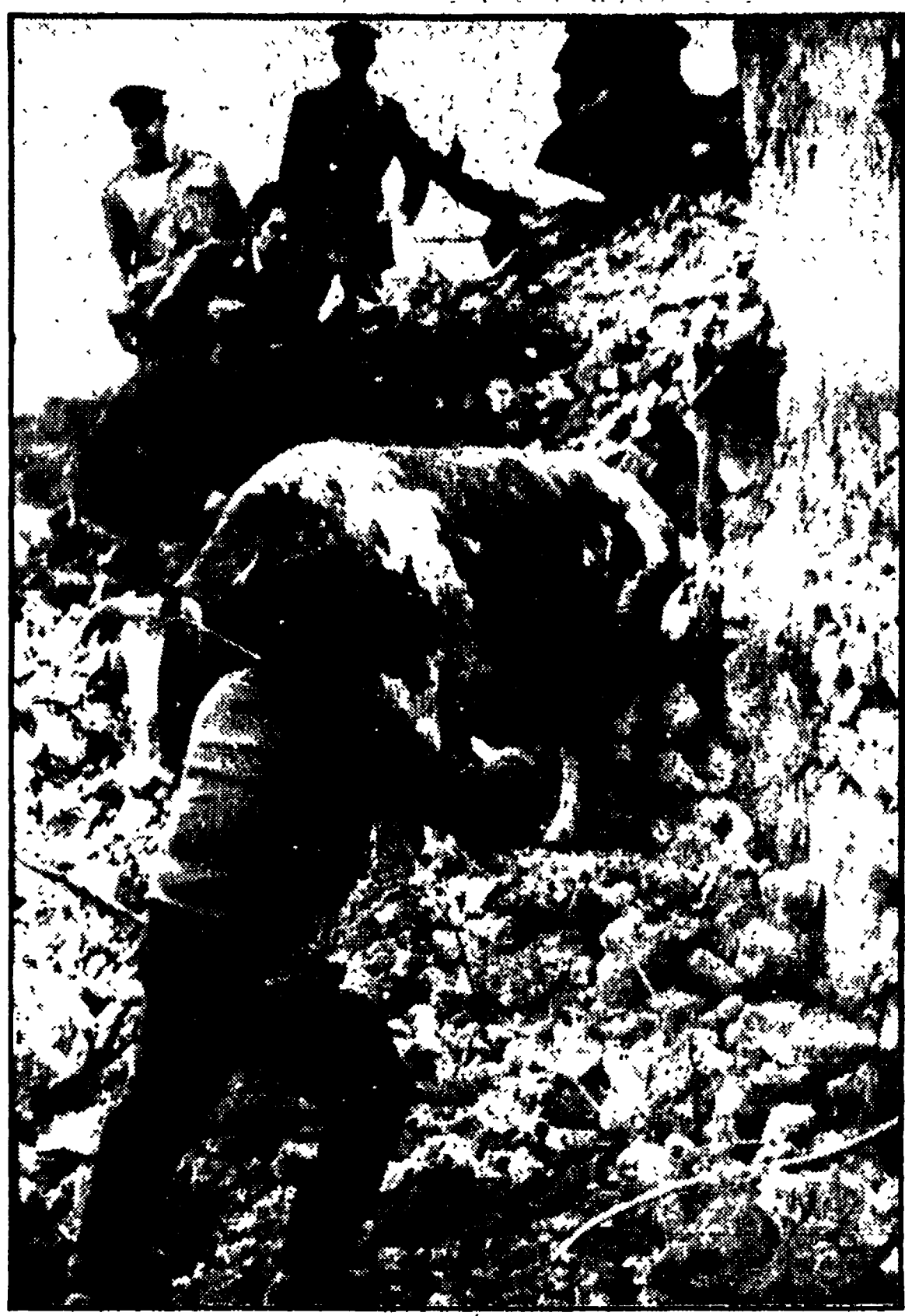
MASSALUBRENSE - Un'immagine di rovina fra le mura diroccate