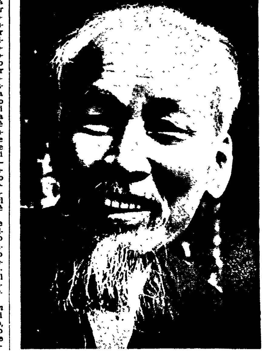
g. f. p.

XX secolo - pp. 224 L. 1.200 - Morale e pratica rivoluzionaria negli scritti di uno dei più grandi dirigenti del movimento operaio internazionale.