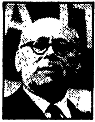
TERRACINI - La sua firma suggerisce la Costituzione: ora lo accusano di eviltipendiosi!