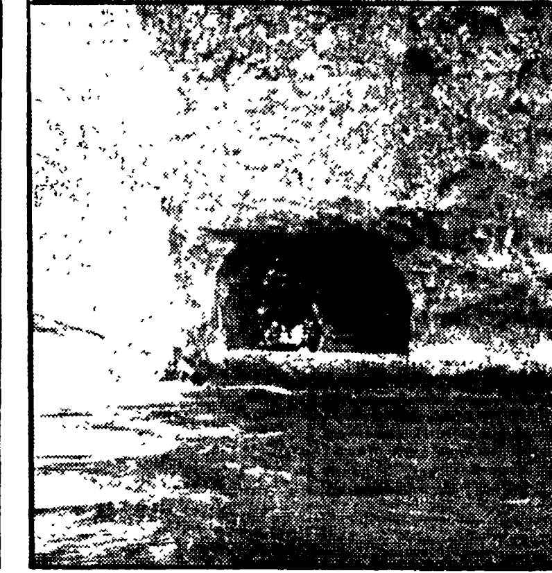
Vignola; a destra un altro scorcio dell'isola con, sullo sfondo, ca 36 milioni. Ancora: costruzione dei pontili di attracco a Montefiascone...