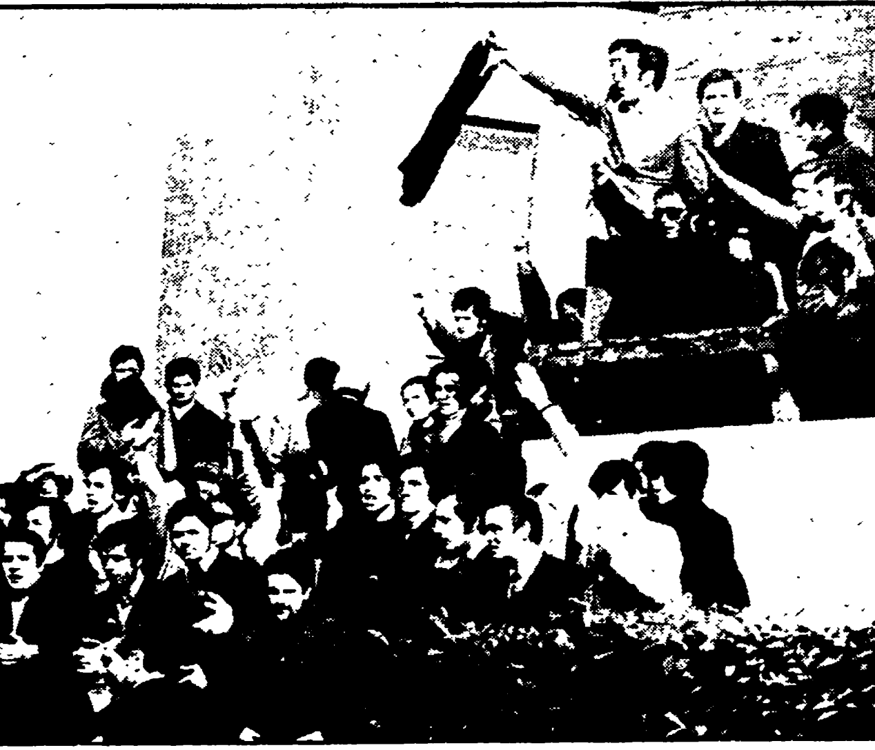
Teppisti fascisti inscenano il saluto romano sulle gradinate della facoltà di giurisprudenza

L'operazione va avanti, con alterne vicende, dallo scorso anno accademico - Intensificati gli episodi di provocazione e aggressione negli ultimi mesi - Cosa cela la richiesta corporativa degli appelli mensili - Un favore per i baroni - Risposta degli studenti democratici e di sinistra