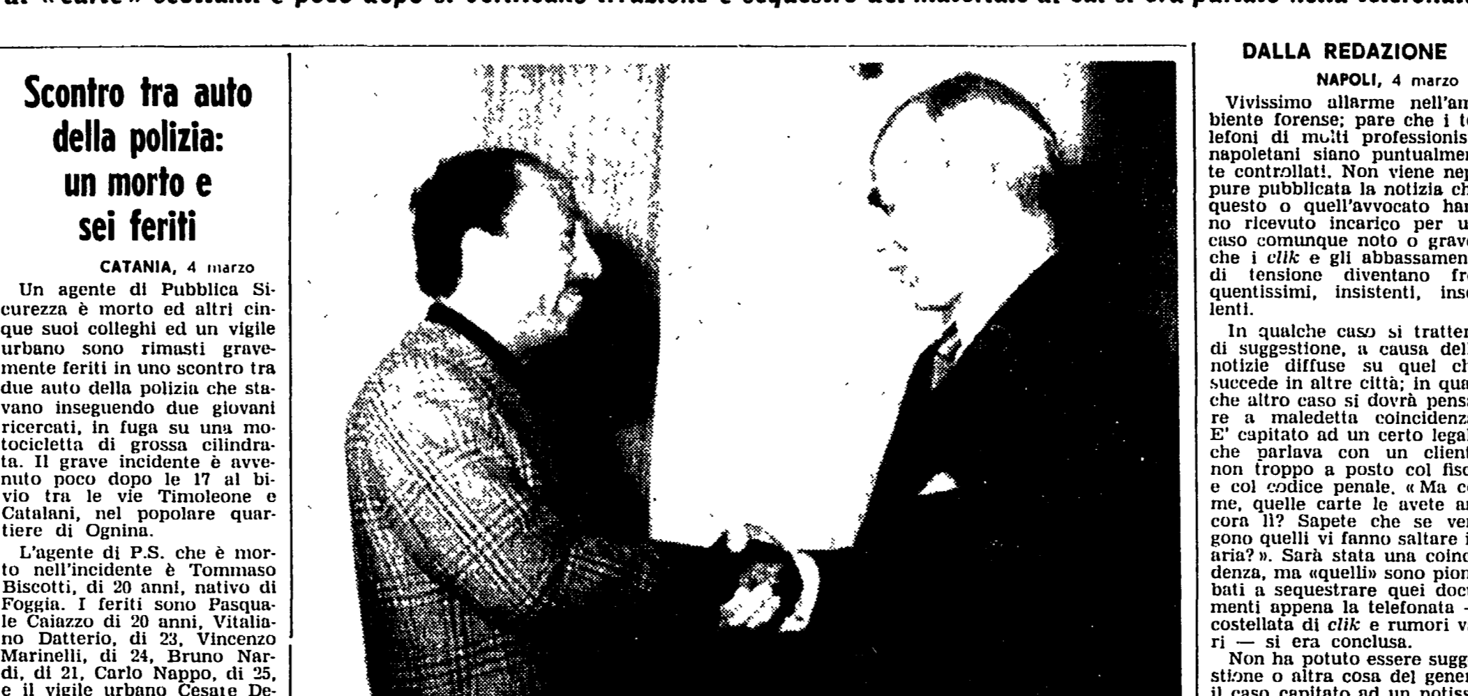
IL RIENTRO DI ISMAIL. IL CAIRO — Il Presidente Anwar Sadat dà il benvenuto al consigliere Hafiz Ismail, appena rientrato al Cairo dalla missione diplomatica svolta in varie capitali.

Frequentissimi «incidenti» che non possono più essere considerati casi fortuiti - Un avvocato parla con il cliente di «carte» scottanti e poco dopo si verificano irruzione e sequestro del materiale di cui si era parlato nella telefonata