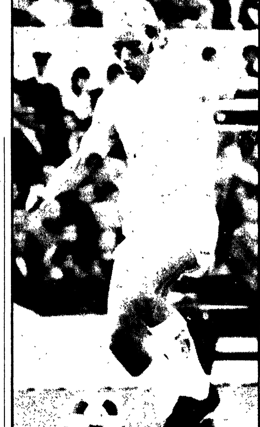
RE CECCONI ieri si è limitato a bagni e massaggi ed i dubbi sulla sua utilizzazione permangono

Formazioni in alto mare per il derby Santarini e Re Cecconi: permangono i dubbi