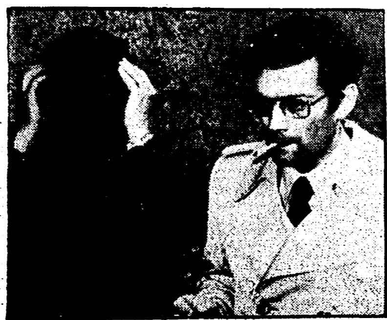
Altri arresti per spionaggio telefonico? Nuovi gravi sviluppi dell'inchiesta sulle intercettazioni telefoniche imposte dal trasferimento dell'istruttoria alla procura della Repubblica...