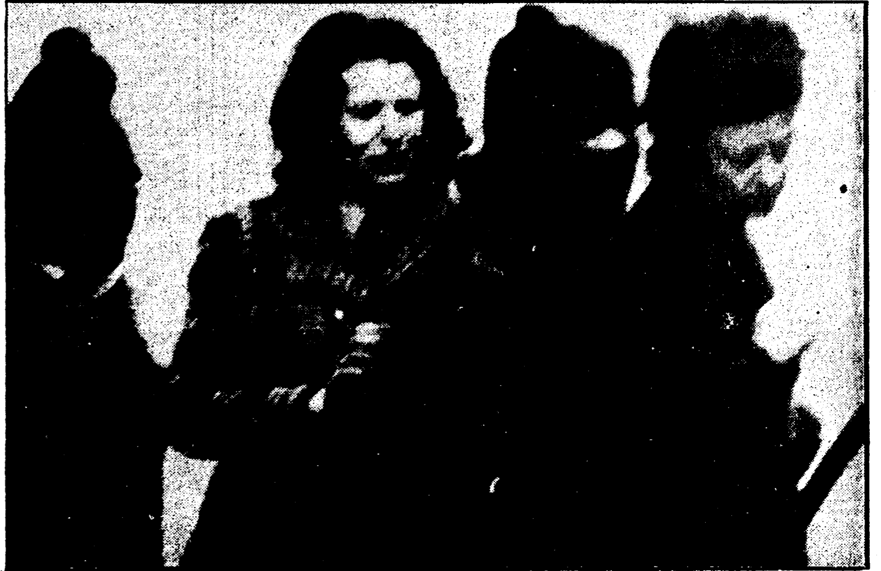
VICENZA - Tragica conclusione di una tentata rapina in una oreficeria. Tre banditi, mascherati con passamontagna, sorpresi dalla polizia si sono barricati nel negozio e, dopo avere ottenuto un'Alfa Giulietta, sono fuggiti portando con loro in ostaggio due donne...

L'auto lanciata a 200 all'ora si è schiantata contro un albero