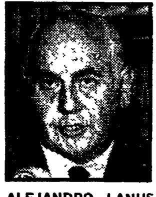
ALEJANDRO LANUSSE - Bilancio fallimentare

E' una scelta che lo stesso generale Lanusse, attuale presidente e mediatore tra le diverse fazioni militari, non si è sentito di contestare.