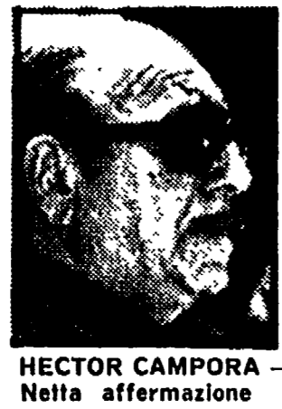
HECTOR CAMPORA - Nella affermazione