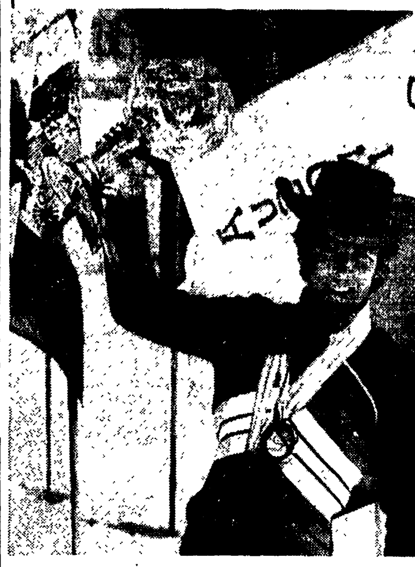
HEAVENLY VALLEY — Gustavo Thoeni mostra, finalmente sorridente, la coppa di cristallo che ha conquistato per la terza volta consecutiva.