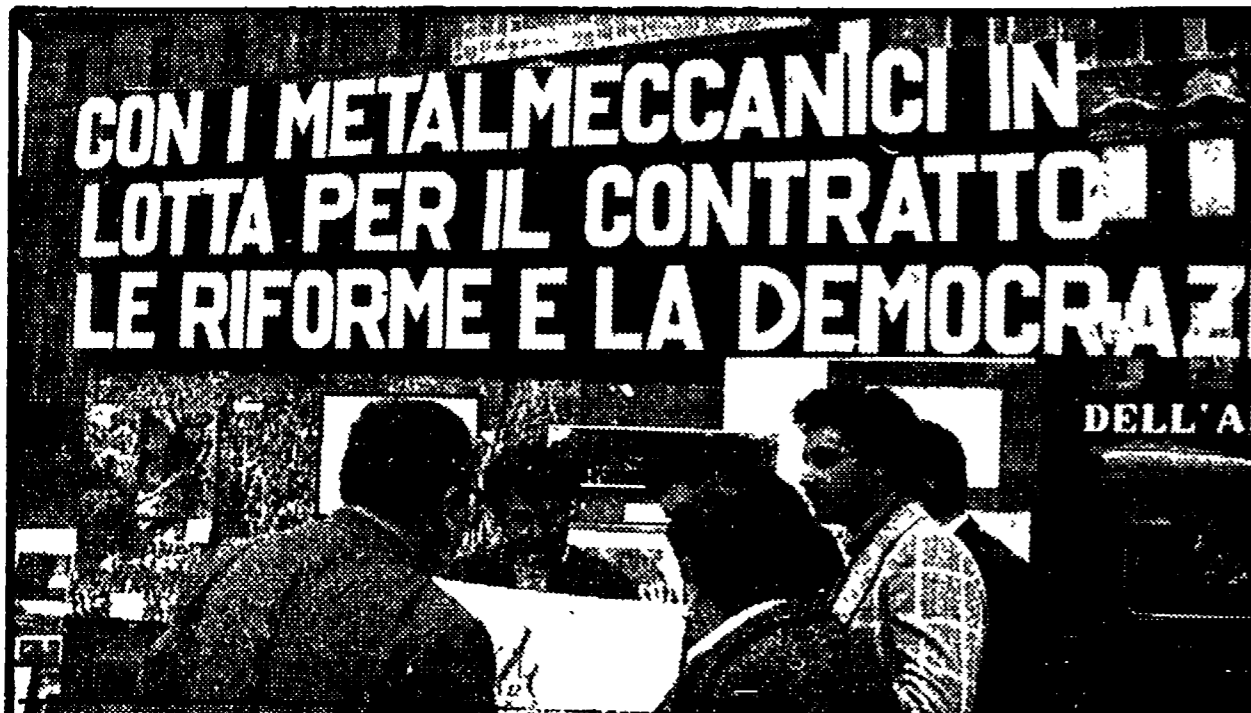
La tenda installata dai metalmeccanici a piazza di Spagna: continuano a giungere numerose le testimonianze di solidarietà

La partecipazione delle altre categorie - Si prepara l'incontro di mercoledì tra metalmeccanici e partiti democratici (PCI, PSI, PSDI, PRI e DC) - Provocazioni e rappresaglie padronali nelle aziende - Chiesti 70 licenziamenti alla ILFEM SUD