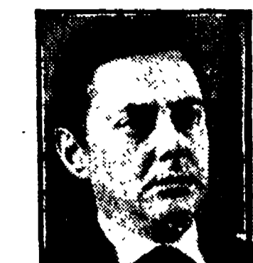
AGNELLI - Non ha detto tutto