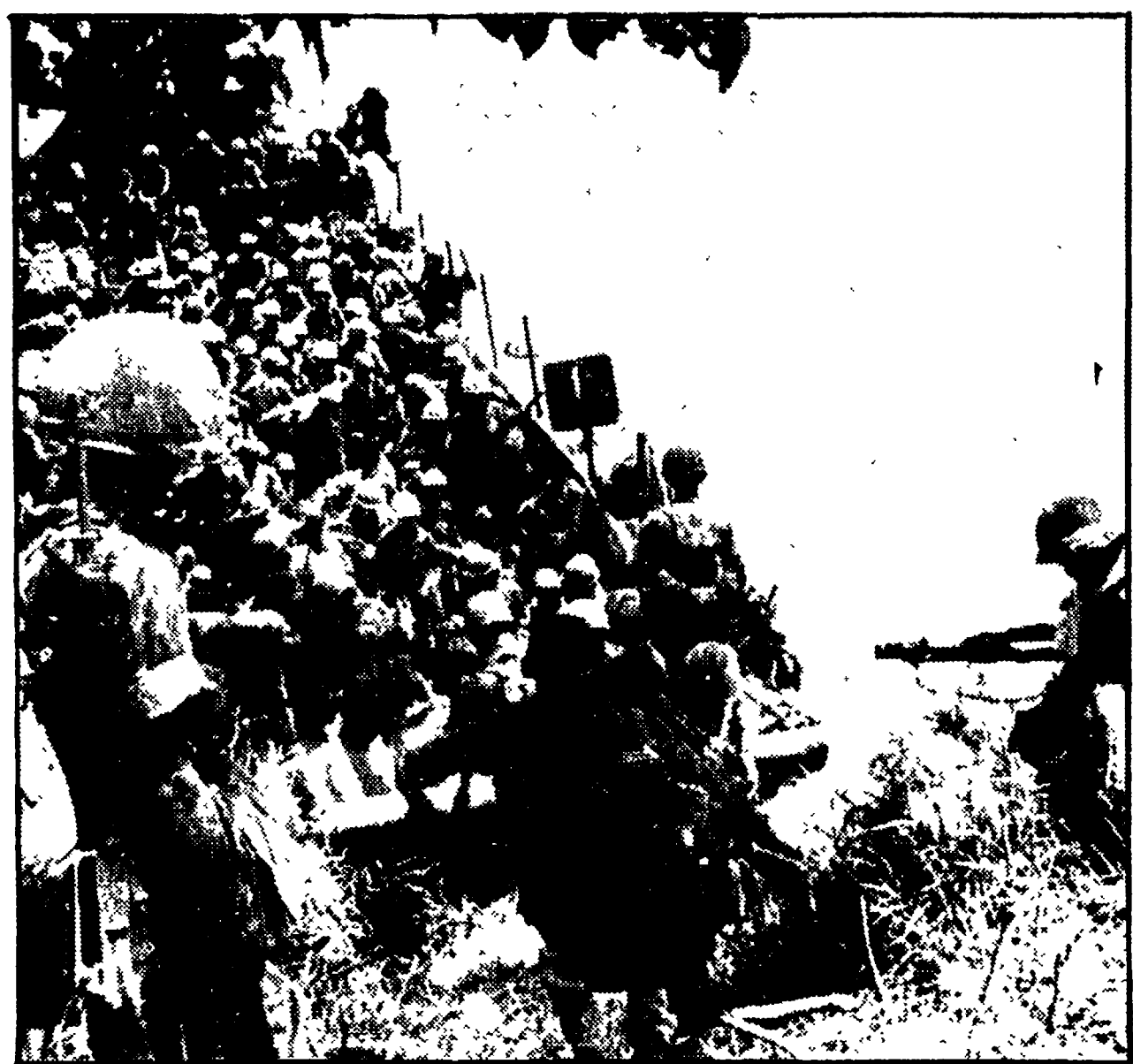
PHNOM PENH - Truppe del traballante regime cambogiano di Lon Nol attraversano il Mekong, nei pressi della capitale, nel tentativo di rompere l'accerchiamento in cui è chiusa Phnom Penh