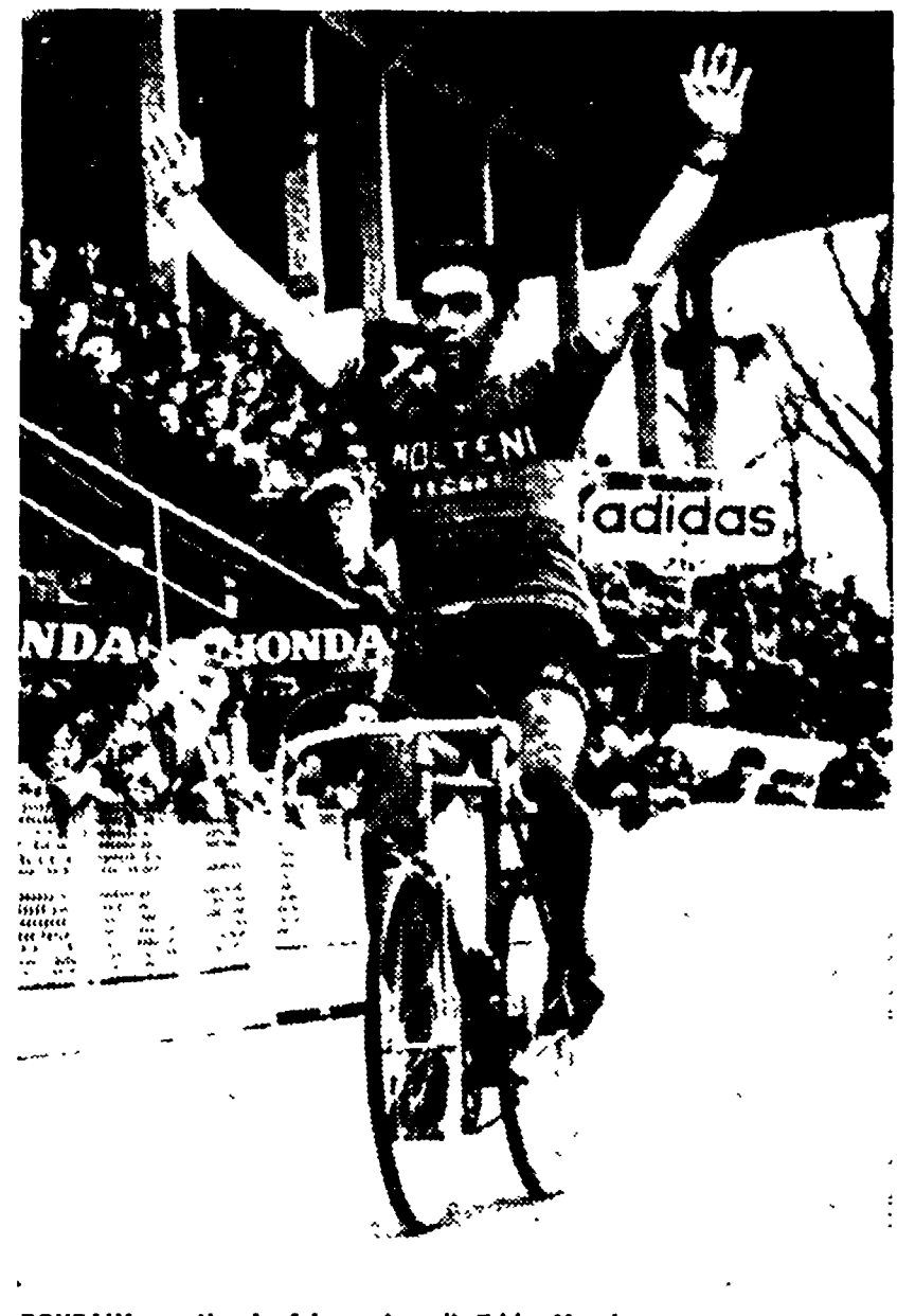
ROUBAIX — Il trionfale arrivo di Eddy Merckx.