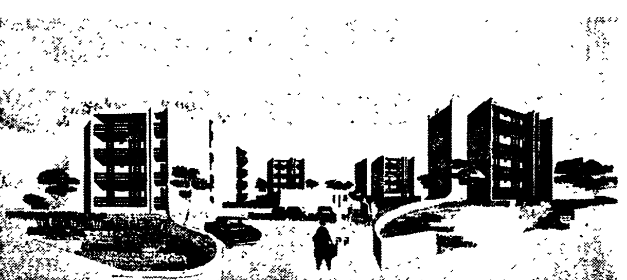
Il disegno schematizza il complesso residenziale «Teodora», ormai prossimo all'ultimazione a Lido Adriano. E' costituito da cinque palazzine con appartamenti di varie dimensioni, vasti balconi protetti verso il vicinissimo mare, il tutto circondato da ampi spazi verdi, esclusivamente pedonali. Il complesso, realizzato dalla Cooperativa CEAMS di Mezzano (Ravenna), conta anche un centro per gli svaghi e lo sport, con annessa piscina.

Strutture moderne ed accoglienti in un ambiente naturale - L'importante iniziativa della CMC