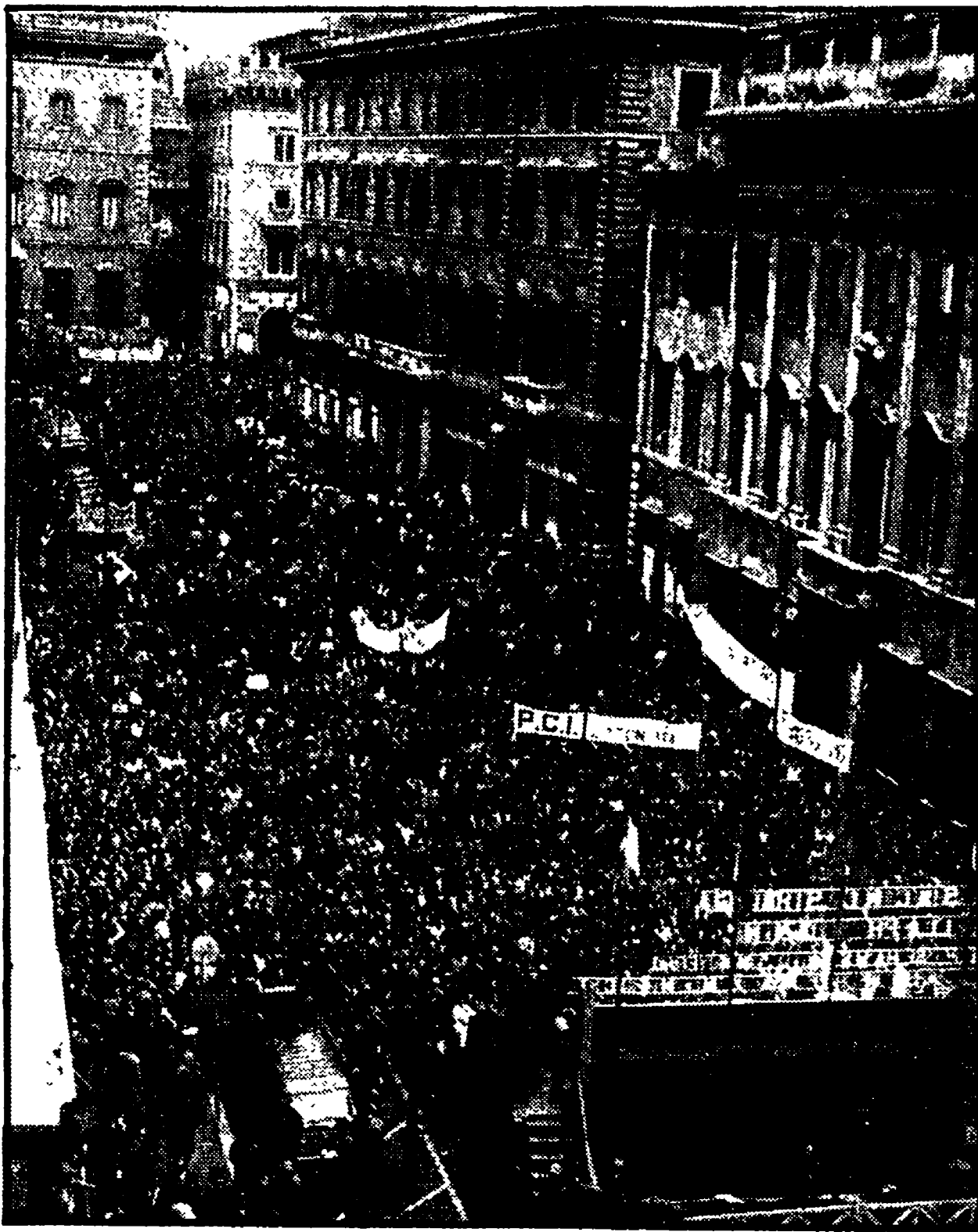
Un'immagine della possente e grandiosa manifestazione antifascista svoltasi giovedì a piazza SS. Apostoli per iniziativa della Federazione comunista romana; in cinquantamila si sono dati appuntamento attorno alle bandiere del PCI per ribadire il loro fermo «no» a fascismo, per esigere un governo capace di una ferma azione in difesa della democrazia