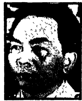
GIAP - Le minacce non ci piegheranno