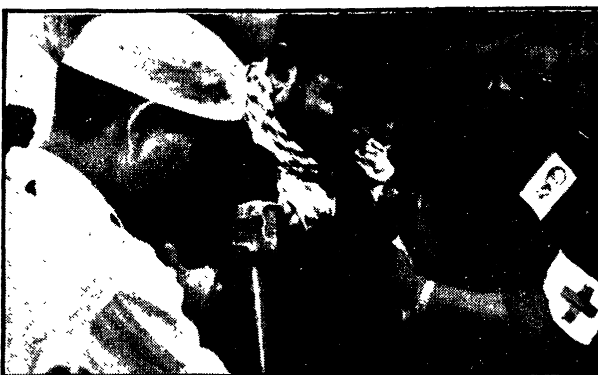
LOC NINH - Un contadino, che è stato detenuto per lunghi anni nelle prigioni di Thieu e che avrebbe dovuto già essere liberato venerdì scorso, è stato finalmente consegnato ieri alla Croce Rossa del GRP.