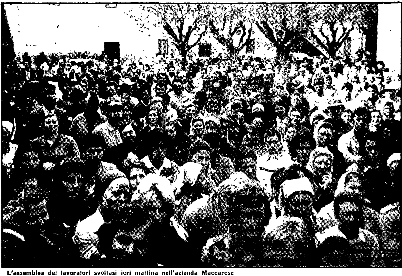
L'assemblea dei lavoratori svoltasi ieri mattina nell'azienda Maccarese

L'azienda voleva ricorrere alla Cassa integrazione per poi ridurre gli organici - Un tentativo per smobilizzare il complesso agricolo delle Partecipazioni statali - Impegni assunti dalla conferenza regionale