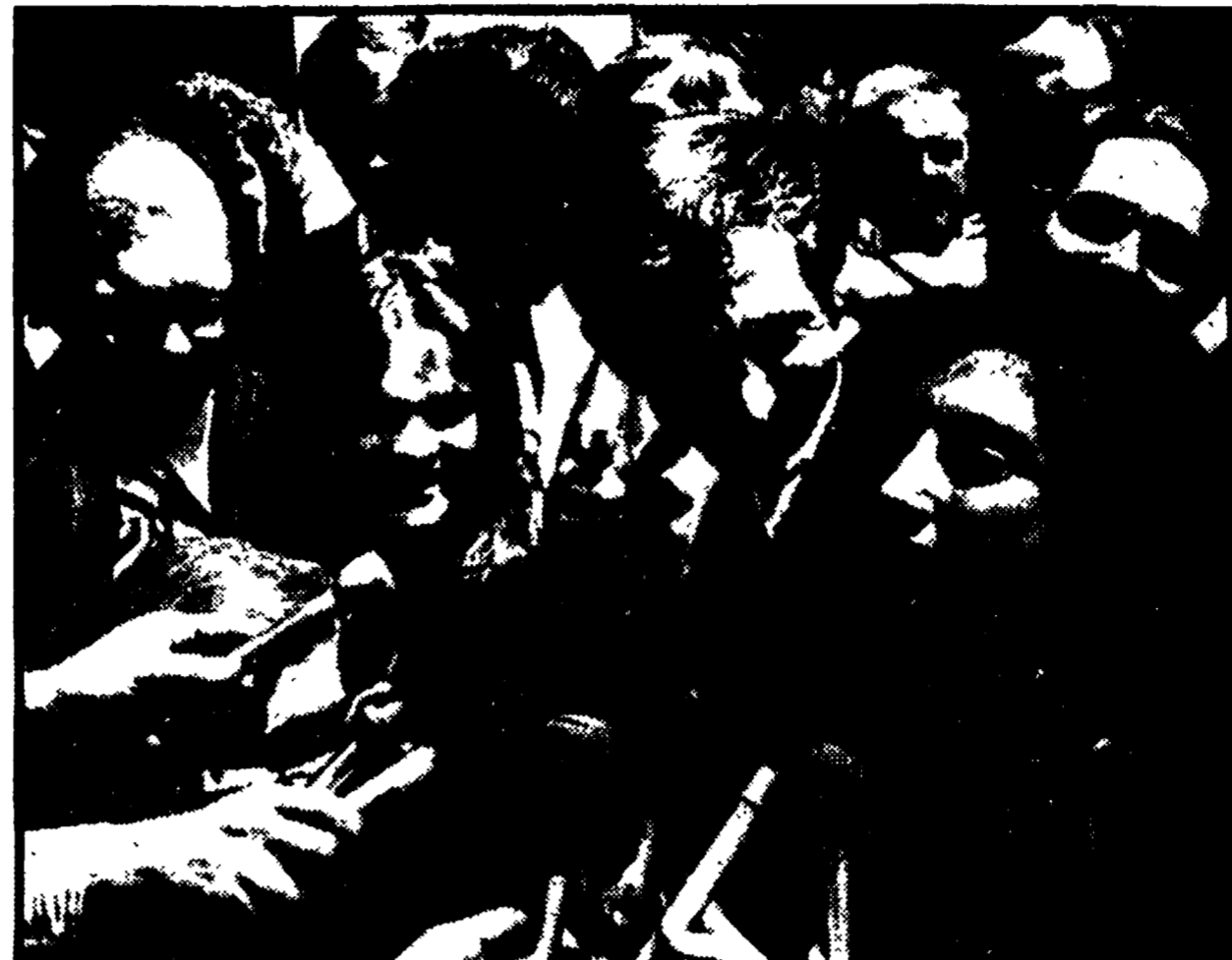
LOS ANGELES — Anthony Russo (a sinistra) e Daniel Ellsberg (a destra) con la moglie che parla al microfono subito dopo l'annuncio di annullamento del processo...