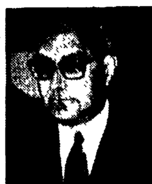
CAETANO - Continuità senza rinnovamento