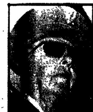
FRANCO - «Stranamente silenzioso»