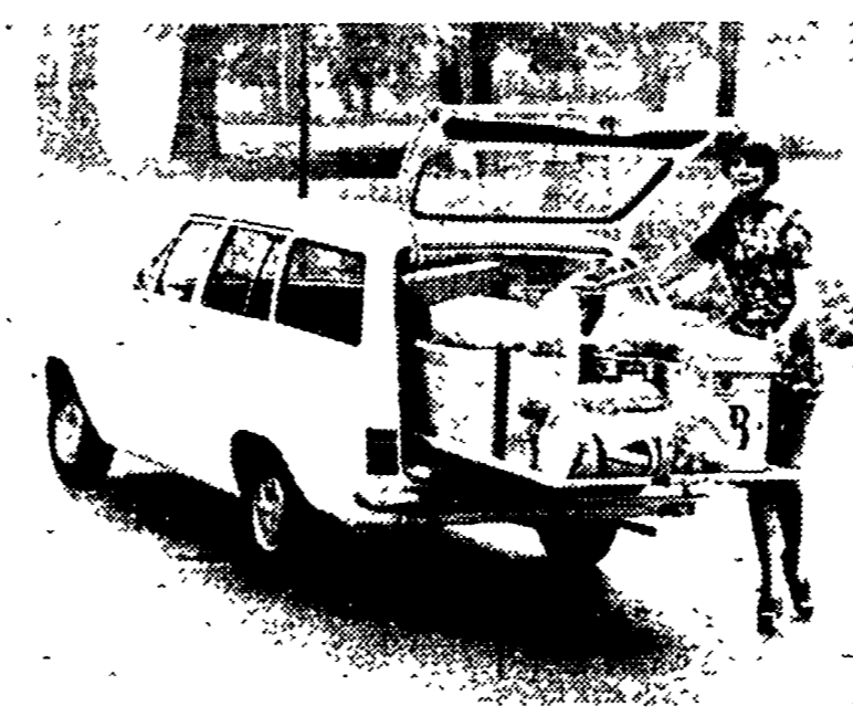
Una «Kadett Caravan» con il «cassetto» aperto.