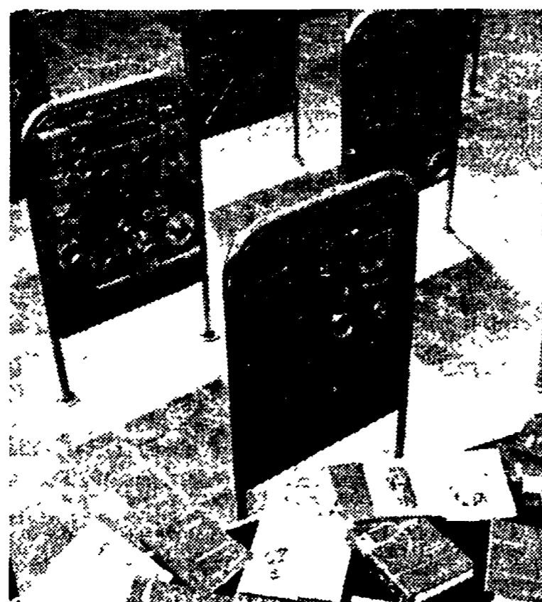
Un esempio delle attrezzature specifiche e delle pubblicazioni relative ai modelli della Fiat che la casa torinese mette a disposizione degli autoriparatori.

Sarà riservato alle parti di autovetture. Una produzione di 300 tonnellate giornaliere - L'assistenza all'assistenza