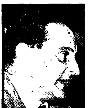
GIACCHINI - Gli artigiani inseriti nel grande movimento di massa