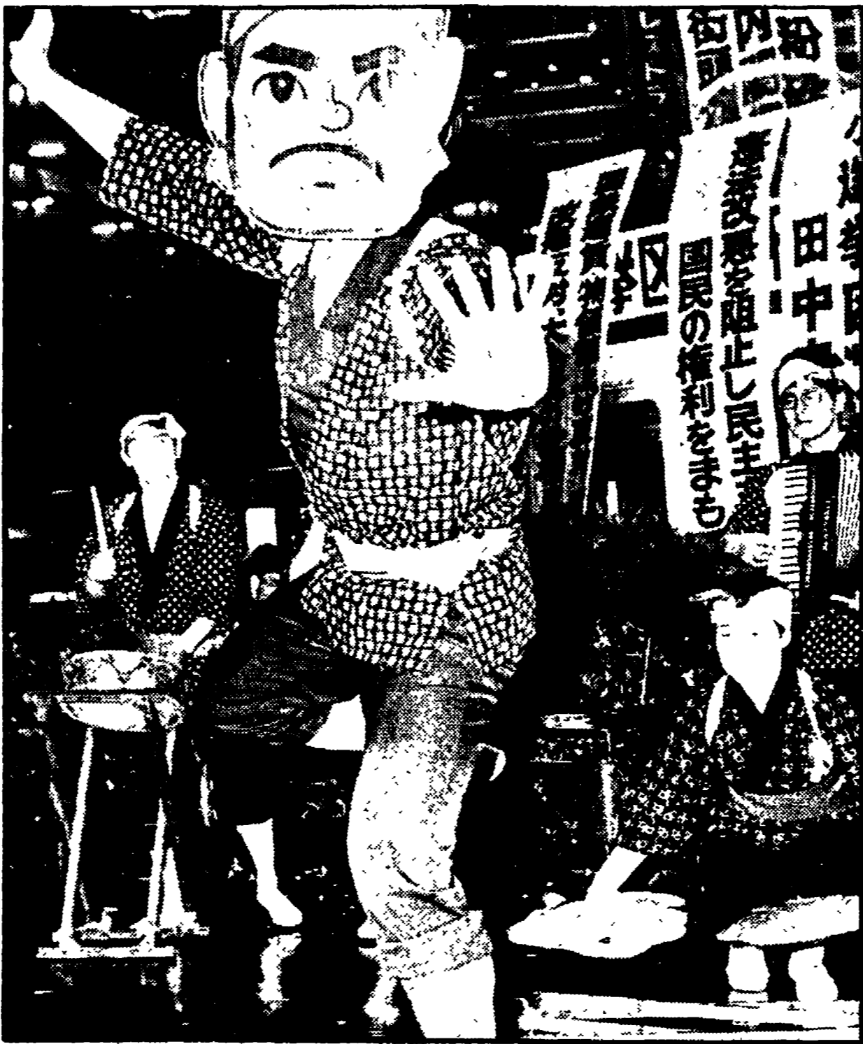
TOKIO — Un fronte imponente di forze politiche, che include i comunisti, i socialisti, il partito Komei, il socialdemocratico e duecentotrenta altre organizzazioni...