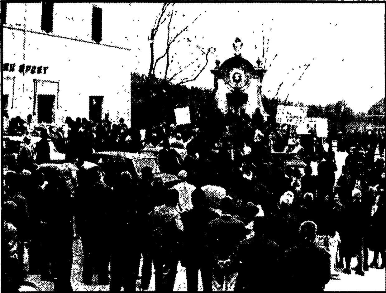
Una manifestazione per lo sviluppo nei Monti Lepini

Il tempo si è fermato all'epoca di Leone XIII - Si torna a votare per il Consiglio comunale dopo la breve esperienza della giunta minoritaria di sinistra - Il commissario prefettizio arriva quando sta per entrare in funzione il piano regolatore - La vocazione clientelare della DC - Due parchi pubblici che disturbano la speculazione