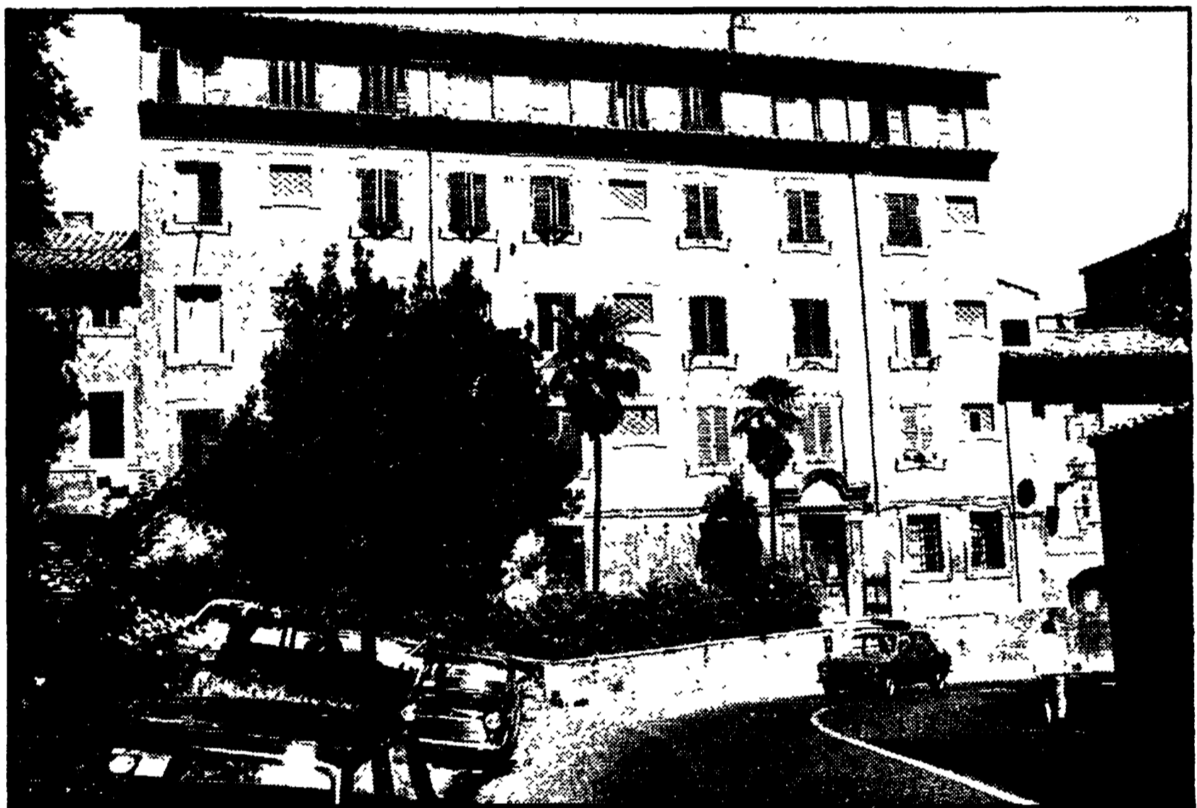
L'edificio di via Garibaldi al Gianicolo completamente ristrutturato: chi ha autorizzato questo tipo di lavori?