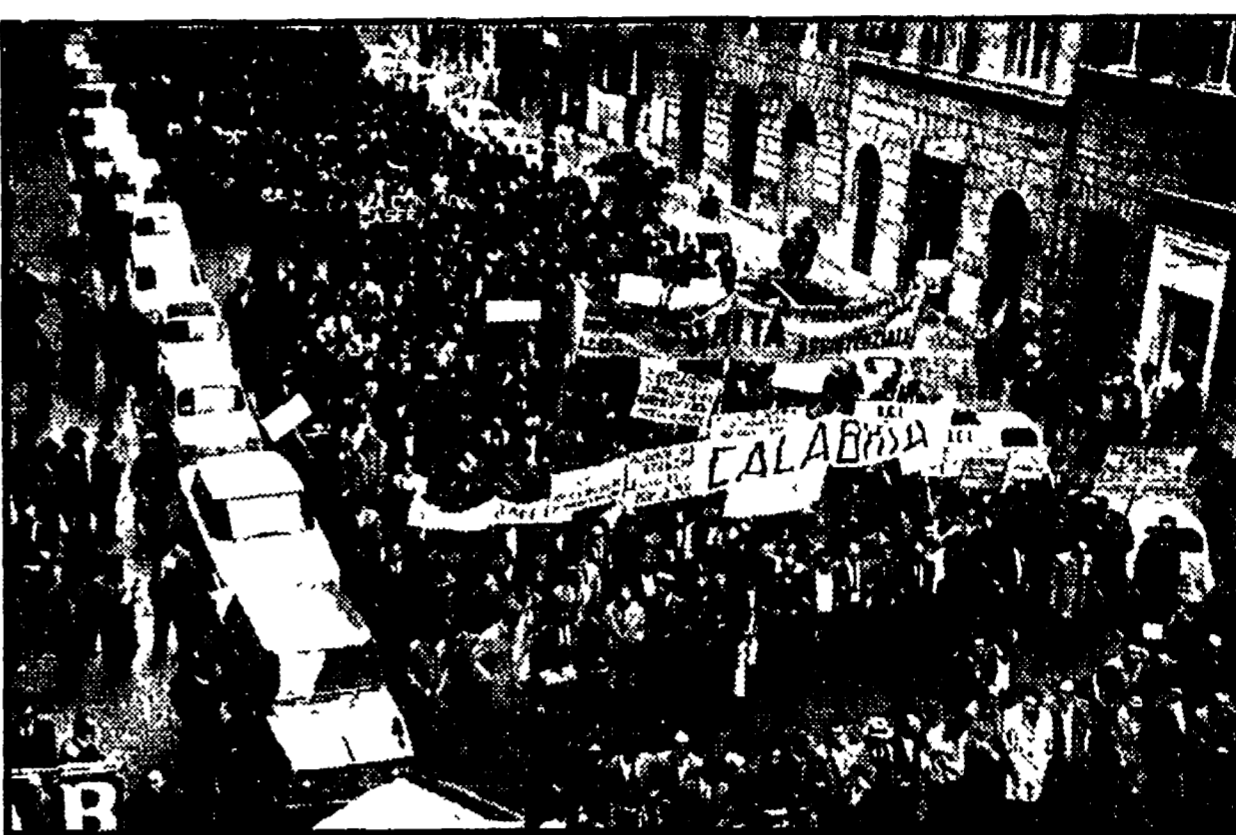
Contadini provenienti da tutta Italia manifestano nell'ottobre scorso per le vie della capitale