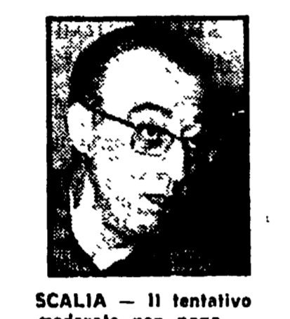
SCALVIA - Il tentativo moderato non paga