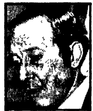
STORTI - Conferma la politica unitaria