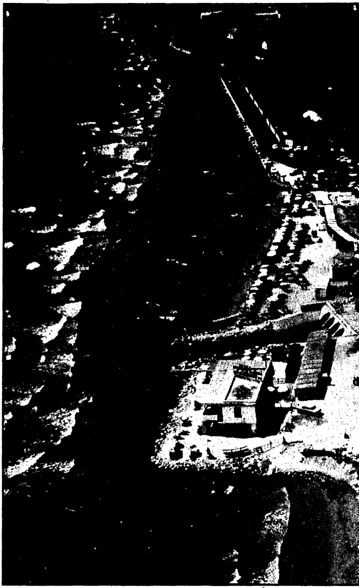
Un'altra bella immagine del litorale pontino nei pressi del Circeo

Sperlonga, Sabaudia, San Felice Circeo, Terracina, Formia. Uno più bello dell'altro, questi luoghi sono tutti racchiusi nella provincia di Latina, centro agricolo, commerciale e industriale in continua espansione.