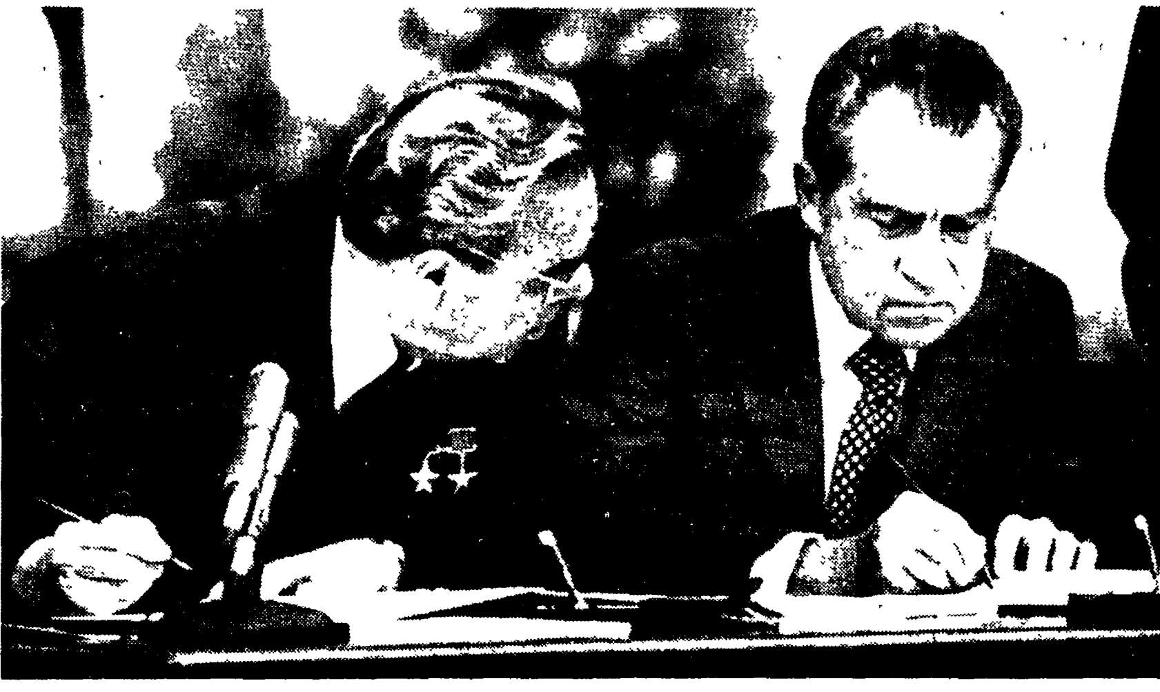
SAN CLEMENTE - Breznev e Nixon mentre firmano il testo del comunicato congiunto, che sarà reso noto oggi.