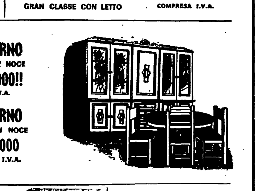
SOGGIORNO CLASSICO IN NOCE L. 228.000 COMPRESA I.V.A.