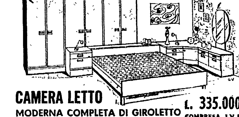
CAMERA LETTO MODERNA COMPLETA DI GIROLETTO L. 335.000 COMPRESA I.V.A.

SENSAZIONALI OFFERTE A PREZZI ECCEZIONALI!!