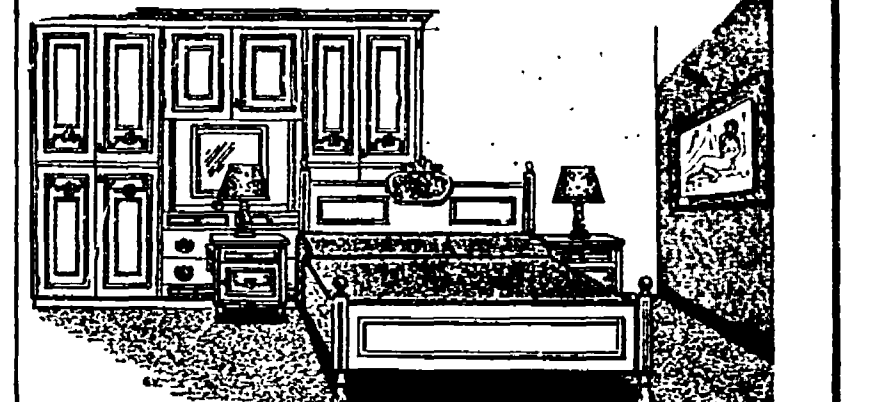
CAMERA DA LETTO L. 395.000!! COMPRESA I.V.A. COMPLETA - RIFINITISSIMA CLASSICA IN NOCE