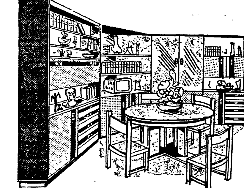
SOGGIORNO MODERNO L. 385.000!! IN PALISSANDRO COMPRESA I.V.A.