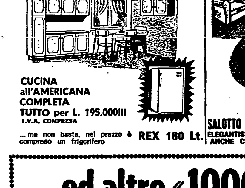
CUCINA all'AMERICANA COMPLETA TUTTO PER L. 195.000!!! I.V.A. COMPRESA