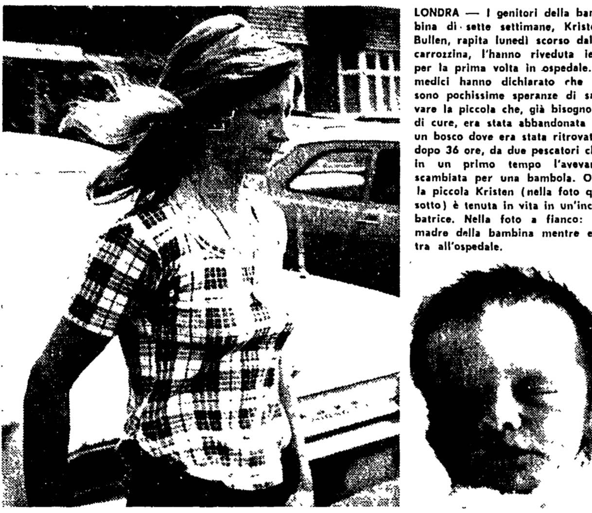
La bimba rapita e ritrovata