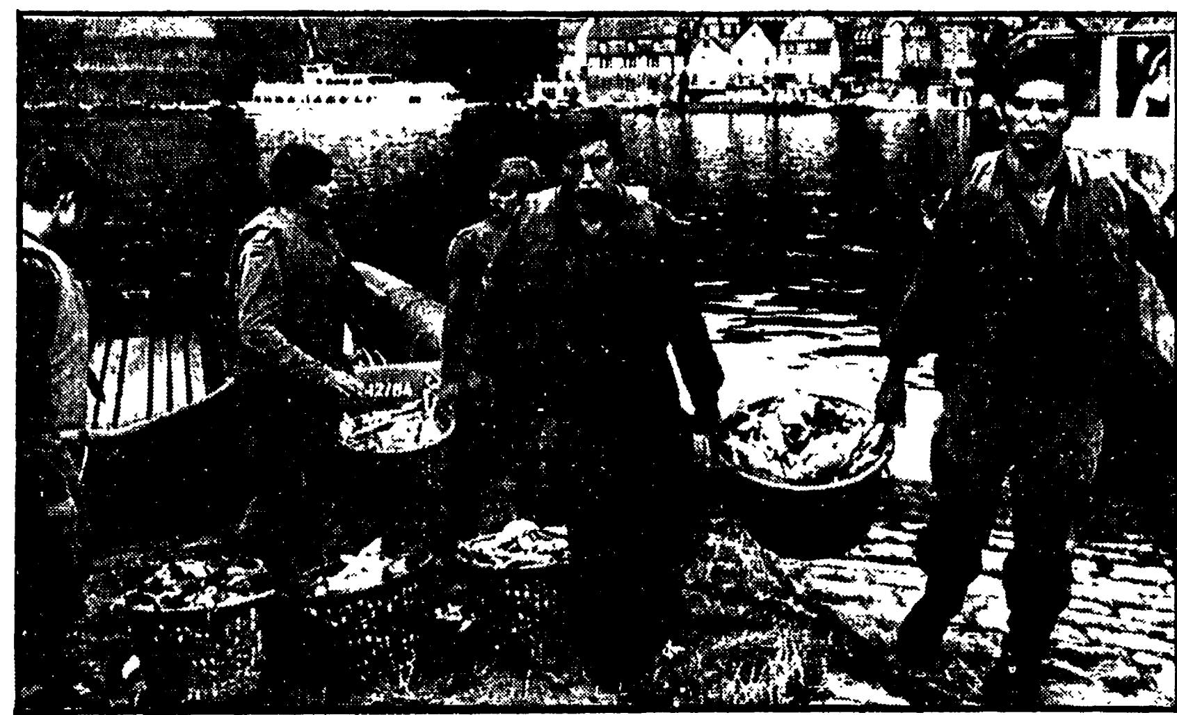
VITTIME DEL CALDO Migliaia di pesci morti vengono tolli dalle acque della Mosella presso la città tedesca di Ballstain. A quanto si dice, la strage di pesce sarebbe stata causata dalla mancanza di ossigeno nell'acqua dovuta all'ondata di caldo che in questi giorni ha colpito la Repubblica federale tedesca

La Banca d'Italia è intervenuta nelle operazioni a scopo commerciale - Un divario del 5% Misure restrittive e correttive contro l'inflazione applicate in Francia - Dichiarazioni di Carli