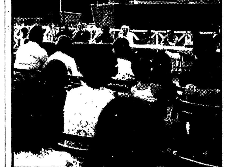
Un momento della tavola rotonda sul cinema al Festival di Cinecittà