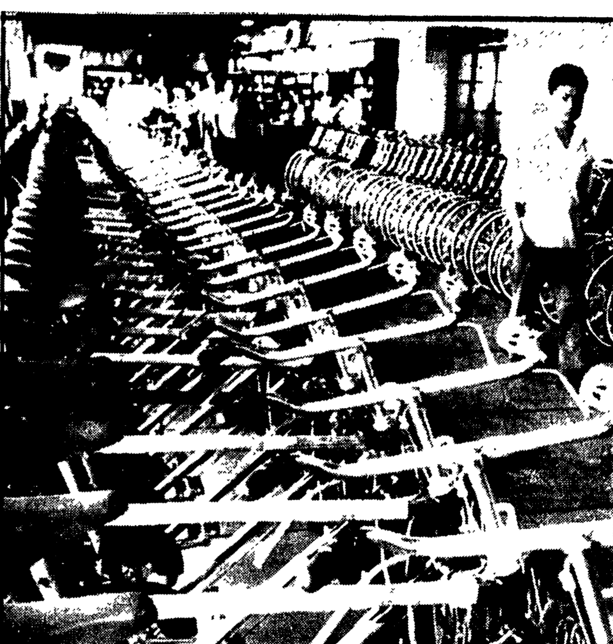
GENERE DI LARGO CONSUMO Centinaia di biciclette sono allineate all'interno di una fabbrica a Pechino, pronte per la consegna. Nella Cina popolare le biciclette sono un genere di largo consumo. Il nuovo modello rappresentato nella foto costa 164 yuan, pari a circa tre mesi di paga media di un operaio