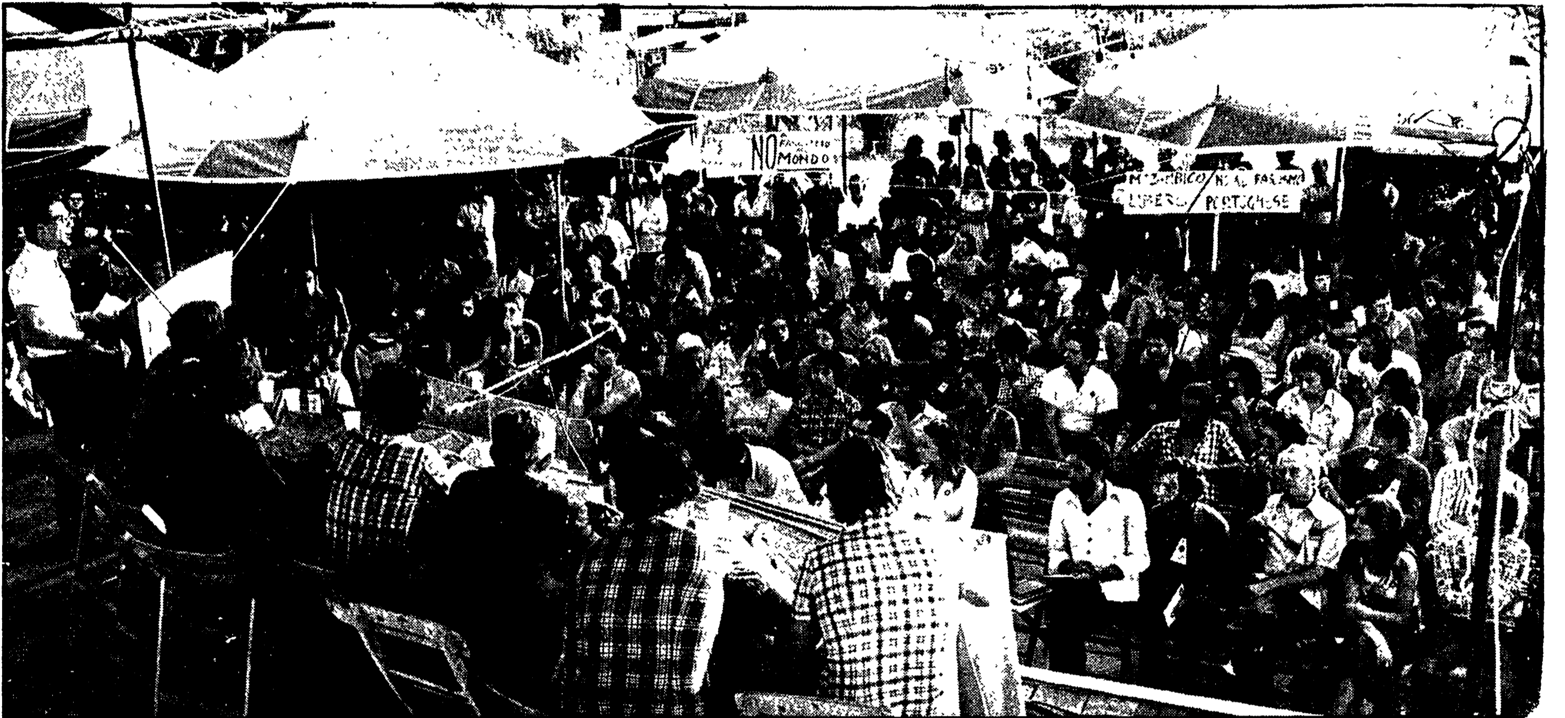
Centinaia e centinaia di giovani hanno partecipato alla manifestazione per il Mozambico conclusasi con un corteo attraverso i viali del Villaggio dell'UNITÀ

All'antifascismo era dedicata anche la proiezione di ieri sera nell'ambito della selezione cinematografica. Ieri sera è stata la volta di un film che risale all'epoca della dittatura: «La conquista dell'impero».