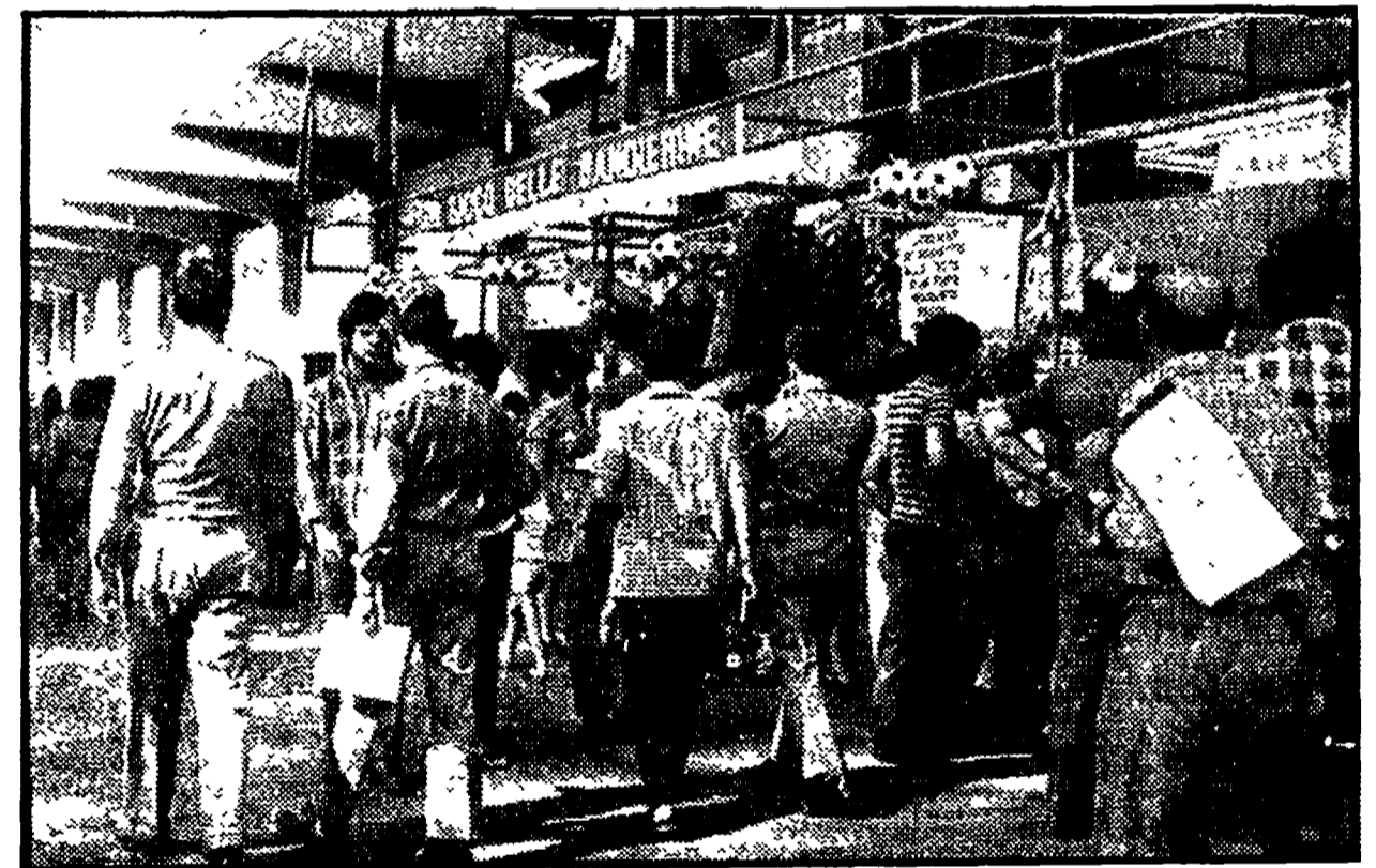
Un gruppo di soldati tra gli stand del Festival