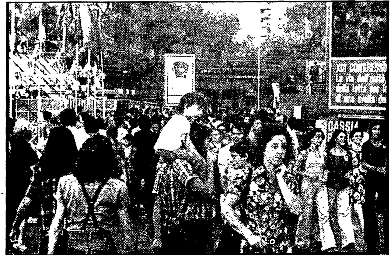
Un viale del Villaggio dell'Unità affollato da visitatori durante la giornata conclusiva

Ferma presa di posizione dell'associazione contro i tentativi di speculazione