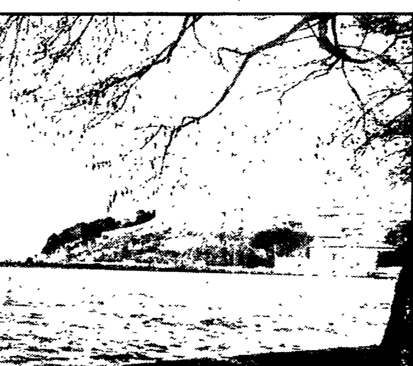
Una veduta del lago di Bolsena divenuto un nuovo obiettivo della speculazione privata

Le acque corrono gravissimi pericoli di inquinamento se andrà ancora avanti il progetto della « Navitalia » - La protesta dei cittadini e delle forze democratiche - Un opuscolo di « Italia Nostra »